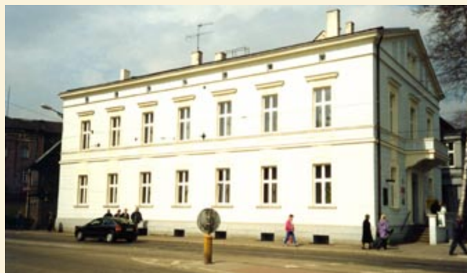
Odnowiona siedziba szkoły