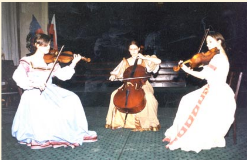
Trio smyczkowe PSM II stopnia