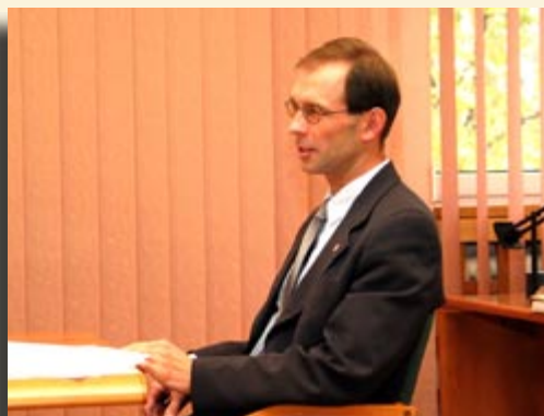
Zygmunt Frankiewicz Prezydent Miasta:

W ostatniej z trzech omawianych uchwał radni wyrazili zgodę na likwidację IX Liceum Ogólnokształcącego przy ul. Okrzei. Będzie to likwidacja poprzez wygaszanie, co oznacza, że obecni uczniowie ukończą edukację w obecnym liceum, natomiast nie będzie już naboru do klas pierwszych. W zamian planuje się utworzyć liceum ogólnokształcące w Sośnicy.