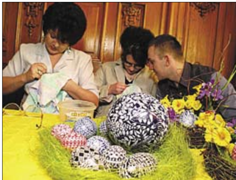
fol. A. Witwicki

Jury oceni wielkanocne cacka według technik ich wykonania w czterech kategoriach: rytownicza – drapane, batikowa – pisane woskiem, tradycyjna „inna” (np. oklejane) oraz nowatorska. Porównane zostaną przede wszystkim walory artystyczne i estetyczne prac, zachowanie tradycyjnych technik i wzorów zdobienia. Uroczyste ogłoszenie werdyktu oraz otwarcie pokonkursowej wystawy odbędzie się w niedzielę, 25 marca, o godz. 12.00. W tym dniu organizatorzy przewidzieli również spotkanie z twórcami pisaneń oraz inaugurację Wielkanocnego Ogrodu Sztuki. – Za najlepsze prace konkursowe osób dorosłych przyznane zostaną nagrody w wysokości: 250 zł (I miejsce), 200 zł (II miejsce) i 150 zł (III miejsce). W grupie dziecięcej i prac zbiorowych wręczane będą cenne nagrody rzeczowe – informuje Dział Upowszechniania Muzeum w Gliwicach. Jego pracownicy przypominają przy okazji, iż prace nie nagrodzone przez jurorów będzie można odbierać od 5 do 30 kwietnia w siedzibie Działu Etnografii. (kik)