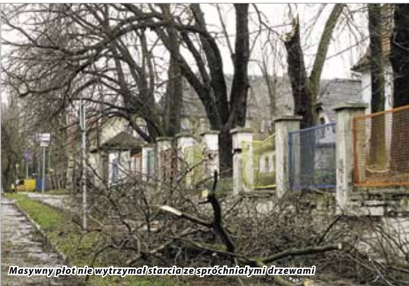
Masywny płot nie wytrzymał starcia ze spróchniałymi drzewami