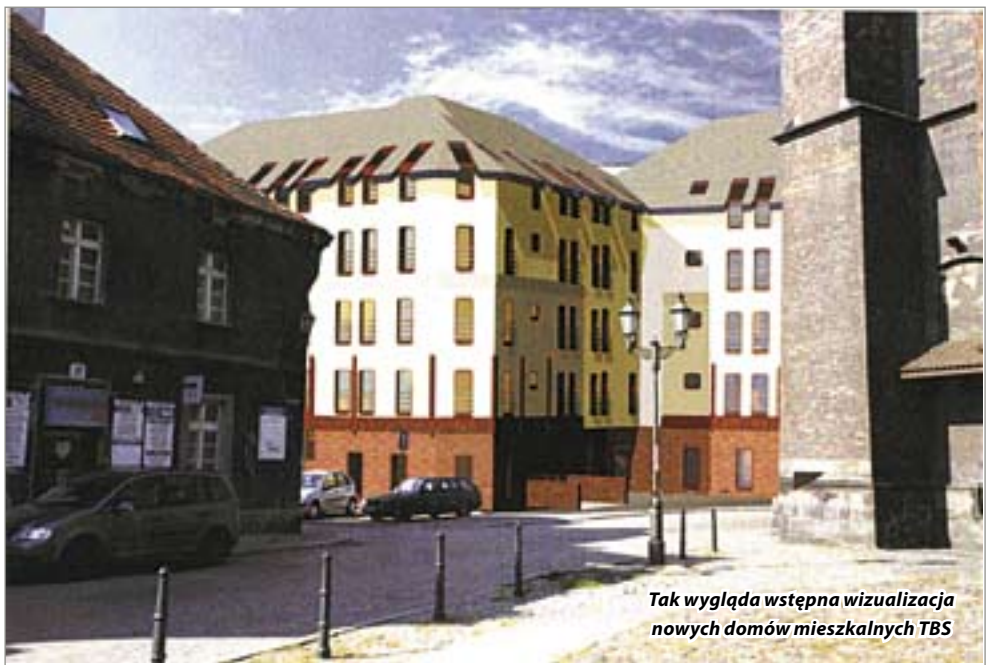
Tak wygląda wstępna wizualizacja nowych domów mieszkalnych TBS

Dopóki nie zostanie zakończona wymiana i modernizacja kanalizacji na Starówce, plac ten będzie stanowił tymczasowe zaplecze budowlane dla tej inwestycji. Potem zostanie zago-