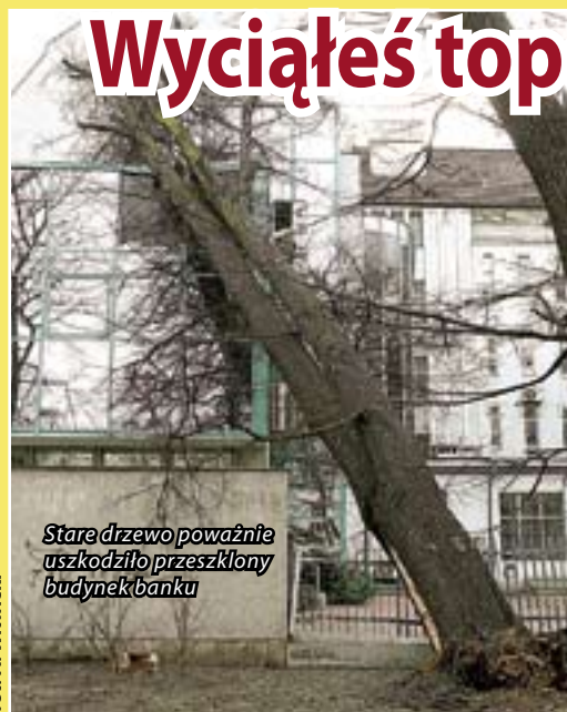
Stare drzewo poważnie uszkodziło przeszklony budynek banku