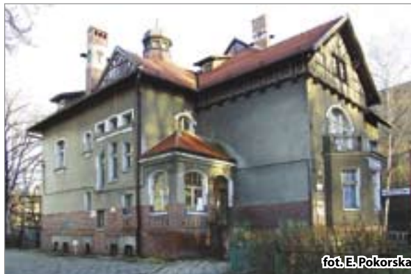
fol. E. Pokorska

projektantów. Drugie miejsce w rankingu zajmuje secesyjna kamienica przy ul. Częstochowskiej 15 (róg ul. Gorzołki). Na trzeciej pozycji plasuje się klatka schodowa budynku sądownego przy ul. Powstańców Warszawy 23. Wyróżnikiem obiektu jest reprezentacyjny hol, doświetlony witrażami, umieszczonymi w dużych prostokątnych oknach.