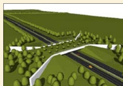
Przejście dla zwierząt

Kilkaset metrów dalej, po wejściu autostrady w las, można już oglądać przejście dla zwierząt o szerokości 35 m, do budowy którego wykorzystano 4.929 m 3 betonu i 592.980 kg stali (!!! – proszę porównać z pozostałymi obiektami mostowymi). Nad drogą gminną z Kozłowa do Bojszowa przerzucono wiadukt o szerokości ponad 34 m, zbudowany z 232.973 kg stali i 1.523 m 3 betonu. Przytoczone liczby dają wyobrażenie o skali przedsięwzięcia. Cdn. (maj)