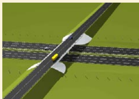
Droga powiatowa nad autostradą

Nad autostradą przebiegać będzie droga powiatowa z Gliwic do Kleszczowa (przedłużenie ul. Kozielskiej). Wiadukt o długości 66 m i szerokości 12,2 m wznosi się na wysokość 4,7 m nad A4. Do jego wybudowania zużyto 1.269 m 3 betonu oraz 97.892 kg stali.