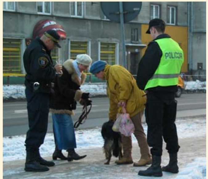
Pouczenie – podstawowa forma dyscyplinowania