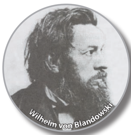
Wilhelm von Blandowski