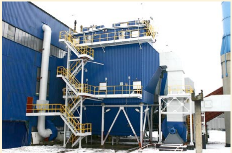
fol. A. Włotwicki

W czwartek, 3 lutego, w Przedsiębiorstwie Energetyki Ciepłej w Gliwicach oddano do eksploatacji zmodernizowany kocioł WR 25 nr 3 wraz z instalacją odpylania. Przedsięwzięcie kosztowało prawie 6 mln zł. Zostało sfinansowane ze środków własnych ciepłowni oraz z 4-milionowej pożyczki udzielonej przez Wojewódzki Fundusz Ochrony Środowiska i Gospodarki Wodnej w Katowicach. Przewidywane oszczędności finansowe z tytułu modernizacji kotła wyniosą – jak się szacuje – ok. 735 tysięcy złotych rocznie (spadek rocznego zużycia miału węglowego o 4.135 ton oraz prognozowane zmniejszenie rocznej emisji zanieczyszczeń atmosferycznych o ok. 149 ton pyłów, 91 ton dwutlenku siarki, 21 ton tlenu węgla oraz 16,5 tony tlenków azotu). Gliwicka ciepłownia dysponuje w sumie siedmioma kotłami. - W okresie pięciu ostatnich lat zmodernizowaliśmy 5 z nich, wprowadzając nowoczesne techniki spalania paliw i zmieniając układ pompowania wody sieciowej – informuje Krystyna Lamboj z PEC. (luz)