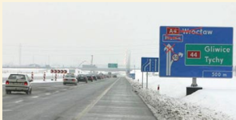
Płatna czy bezpłatna?