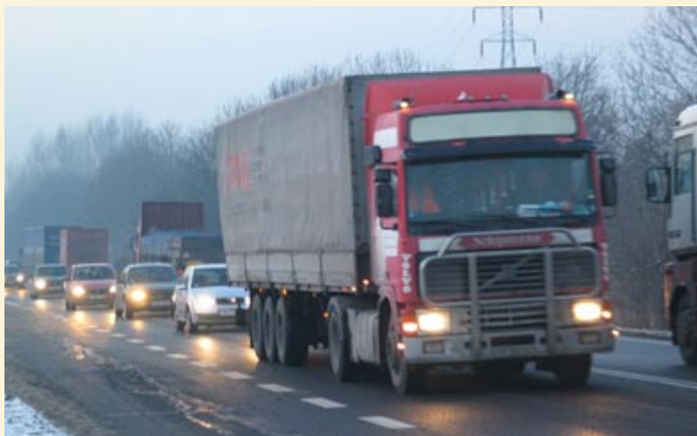
Aby jechać, trzeba niestety uzbroić się w cierpliwość

Sprawa opłat wciąż nie jest rozstrzygnięta. Przejazd trasą A4 w ruchu lokalnym od Katowic do Zabrze będzie bezpłatny. Tymczasem darmowy przejazd na odcinku gliwickim, pomiędzy „Kleszczowem” a „Sośnicą” wcale nie jest przesądzony. - Wprawdzie Generalna Dyrekcja Dróg Krajowych i Autostrad, jak wynika z wcześniejszych informacji ministra Kurylczyka, podjęła decyzję o wyłączeniu