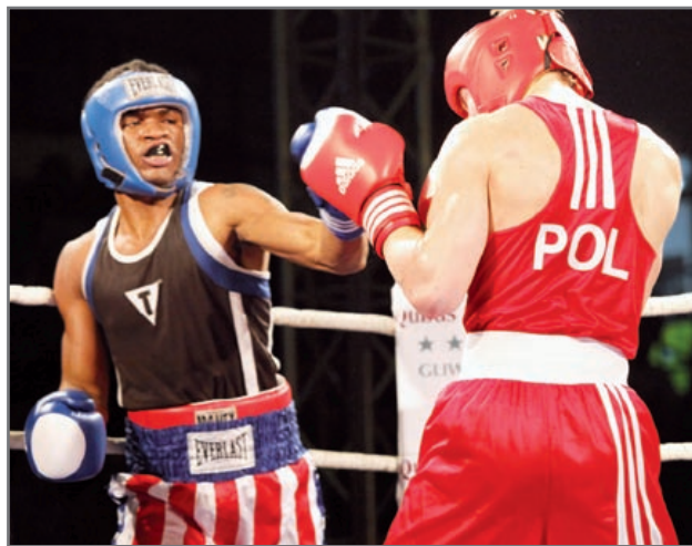
Polacy pokonali Amerykanów w obydwu spotkaniach – w Knurowie i w Gliwicach

Sportową rywalizację zorganizowali: TUR Gliwice – Centrum Sportu i Wypoczynku, Gliwicki Uczniowski Klub Sportowy „Carbo”, Bokserski Klub Sportowy „Concordia” Knurów oraz Polski i Śląski Związek Bokserski. Mecze poprzedziła konferencja pra-