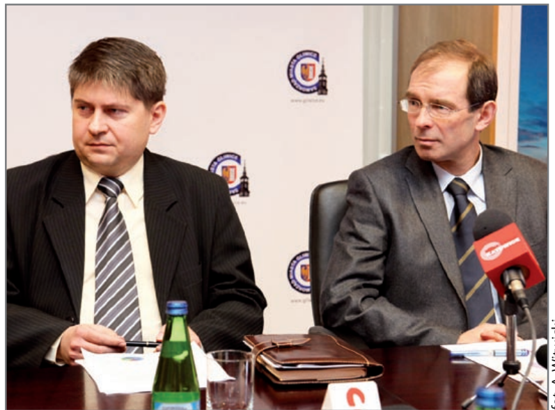
fol. A. Witwicki