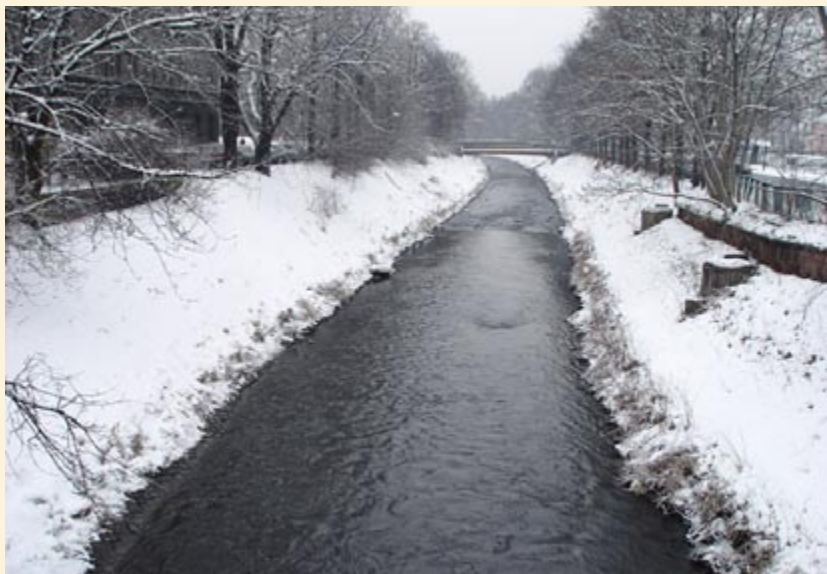
Celem programu jest przywrócenie pełnej czystości wodom rzeki i udostępnienie terenów nadrzeczna mieszkańcom Śląska

Problemy, które trzeba pokonać to m.in. dopływ nie oczyszczonych ścieków komunalnych, nielegalne zrzuty ścieków z szamb przydomowych, nagromadzenie toksycznych osadów dennych, niepełne oczyszczanie ścieków w oczyszczalniach starego typu oraz obciążenie wodami kopalnianymi. W ramach programu będą podejmowane i integrowane konkretne działania zmierzające do oczyszczenia wód zlewni Kłodnicy i określone harmonogramy prac. Zostanie też wypracowana wspólna strategia pozyskiwania środków finansowych. GZE zadeklarował finansowanie prac związanych z koordynacją programu, natomiast zadania inwestycyjne będą finansowane ze środków zewnętrznych, głównie z funduszy Unii Europejskiej. (al)