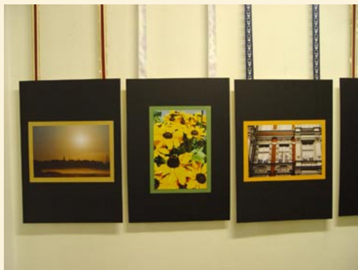
Wystawa będzie prezentowana do 11 lutego