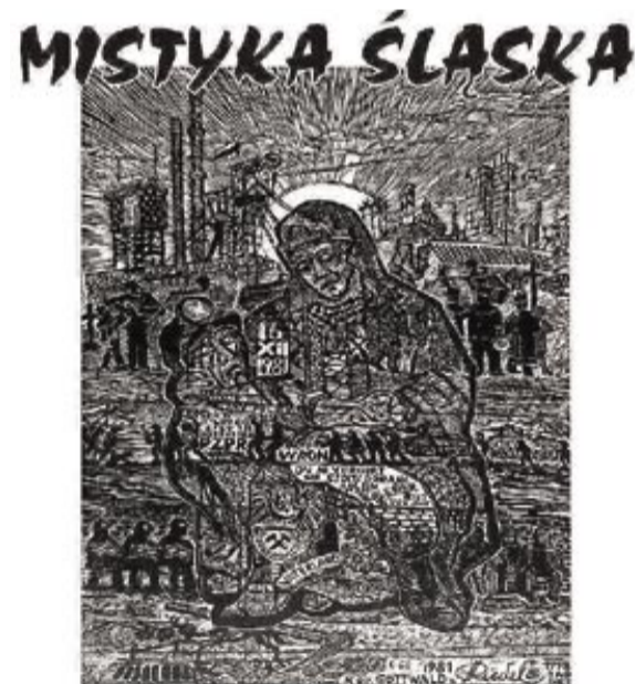
WYSTAWA ŚLĄSKICH TWÓRCÓW NIEPROFESJONALNYCH - MALARSTWO I RZEŻBA W WĘGLU

Centrum Edukacyjne im. Jana Pawła II w Gliwicach zaprasza na otwarcie wystawy malarstwa i rzeźby w węglu. Autorami prac są regionalni twórcy nieprofesjonalni. Ekspozycja pt. „MISTYKA ŚLĄSKA” zostanie udostępniona w siedzibie CE w niedzielę, 3 grudnia, o godz. 16.00. W ramach wernisażu odbędzie się kameralny koncert muzyczny.