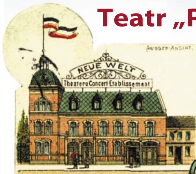
Tak w przeszłości wyglądał budynek przy Nowym Świecie (fragment pocztówki z 1898 r.)