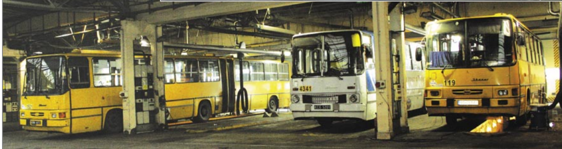
Ocieplona hala napraw autobusów w siedzibie PKM