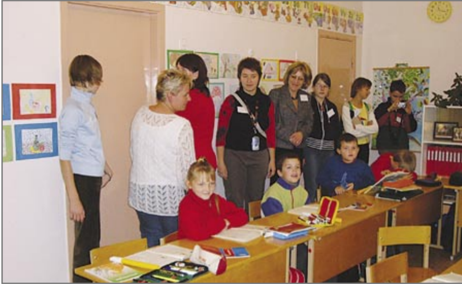
Wizyta w litewskiej szkole