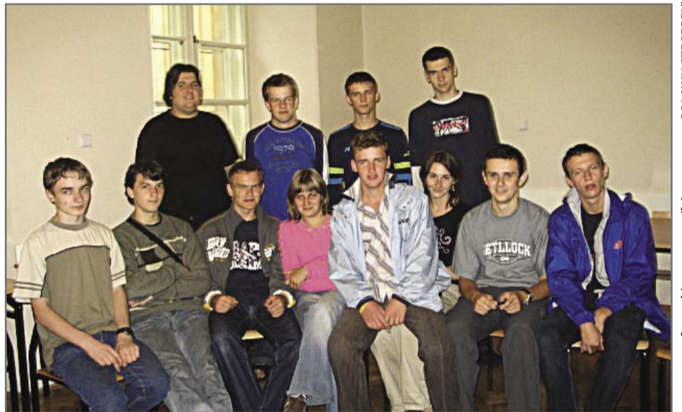
Uczestnicy kampusu „nowych technologii”