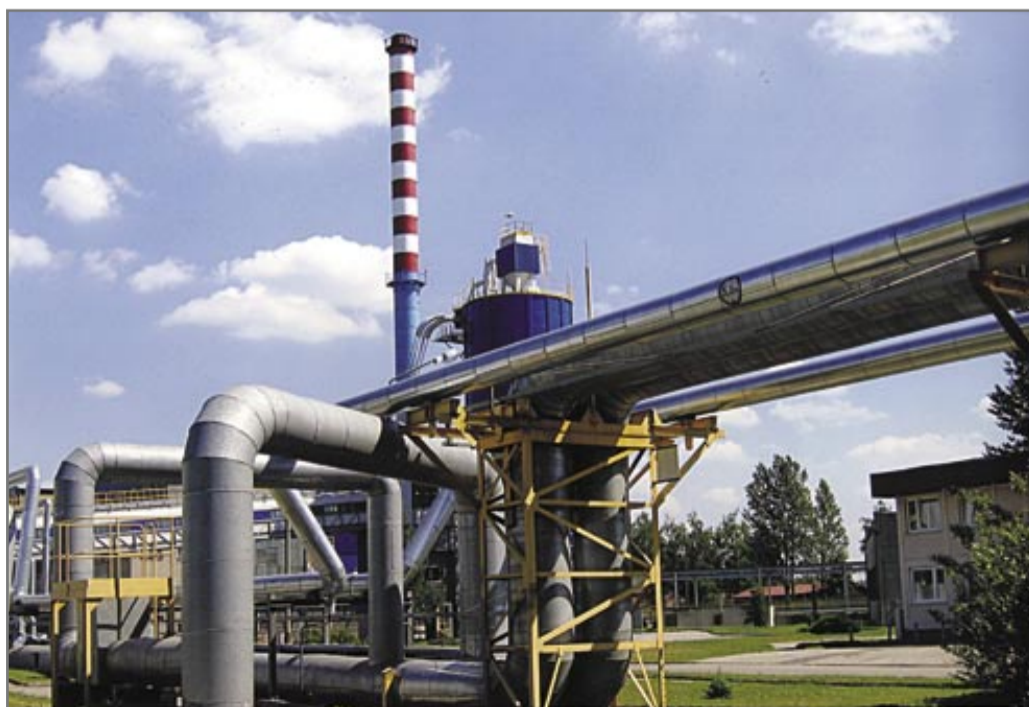
Niebo nad ciepłownią PEC jest znacznie czystsze, niż jeszcze kilka lat temu