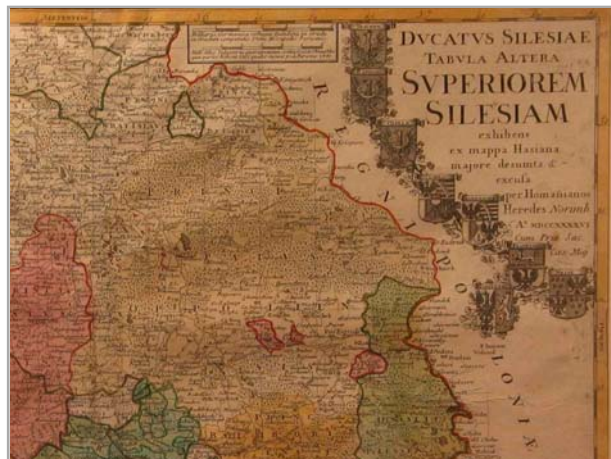
Fragment mapy Hasjana z 1746 roku