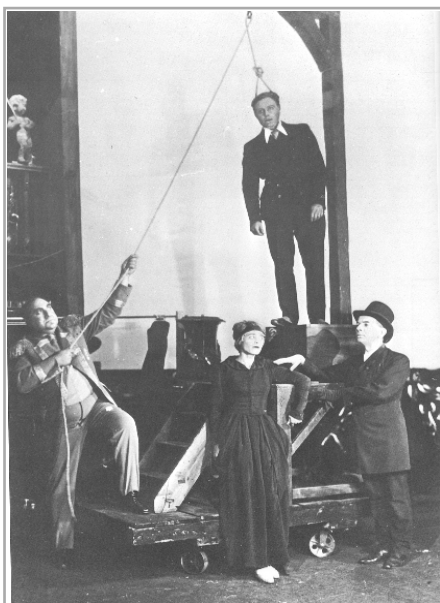
Finał „Opery za trzy grosze” (1928), czyli egzekucja – na szczęście odwołana w ostatniej chwili – Mackiego Majchra

W każdym razie skromne zamierzenie adaptacji klasycznej już opery nieco się rozrosło i przybrało ostatecznie postać dzieła właściwie zupełnie nowego. Po serii katastrof, jakie spadły na realizatorów spektaklu (m. in. atak wyrostka robaczkowego u jednej z aktorek), powodujących wiele skrótów w poszczególnych scenach, z oryginału został właściwie tylko zarys akcji, jej podstawowy wątek opowiadający dzieje „wojny” Mackiego Majchra – przywódcy bandy złodziei – z Peachumem, królem londyńskich żebraków.