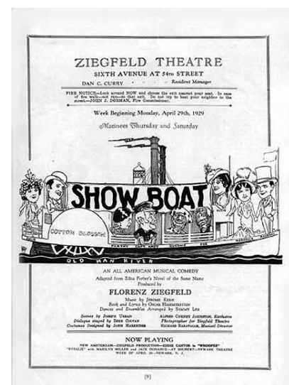
Gwiazdy „Statku komediantów” w karykaturze

O Oskarze Hammersteinie jeszcze nie raz usłyszymy. Dzisiaj natomiast przyjrzyjmy się Jerome Kernowi. Rodowity nowojorczyk, z pochodzenia pół-Słowianin (jego matka była Czeszka), karierę muzyczną rozpoczął w sposób zaiste niezwykły. Otóż, jego ojciec, kupiec, wysłał go jako przedstawiciela swojej firmy do Bronxu, żeby kupił dwa fortepiany. Jerome kupił ich dwieście. Dlaczego? Po prostu uwielbiał muzykę i w ten sposób chciał dać wyraz swojemu uwielbieniu (dopiero po tym wypadku niemalże zrujnowany ojciec zgodził się na wysłanie syna do szkoły muzycznej). Po poważnych studiach w akademiach w Nowym Jorku i Heidelbergu, pracował najpierw jako zwyczajny song-plugger, czyli „knajpiany” popularyzator piosenek. Szybko jednak zaczął komponować piosenki do różnych muzycznych sztuczek. Jedną z nich, „ They Didn't Believe Me ”, stała się wielkim sukcesem i otworzyła mu drogę do kariery. Wkrótce Kerna zatrudniono w nowojorskim Princess Theatre, którego kierownictwo starało się stworzyć konkurencję dla rewii Florenza Ziegfelda.