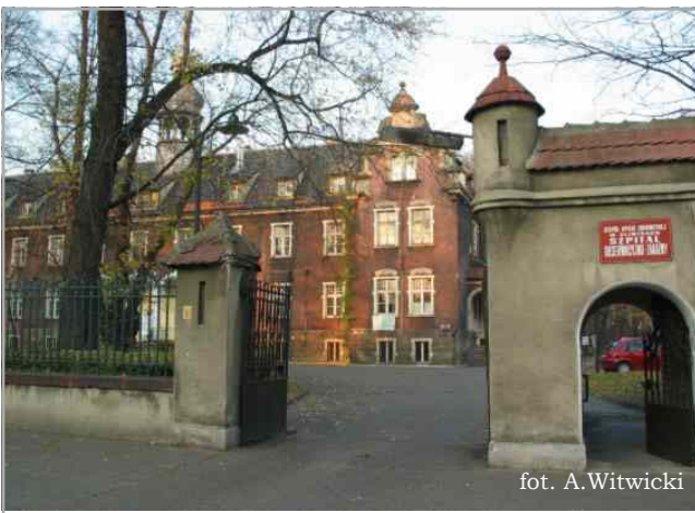
Zaproponowano likwidację szpitala zakaźnego przy ul. Kozielskiej

Przygotowano projekt programu restrukturyzacji lecznictwa szpitalnego w Gliwicach. Dokument będzie konsultowany z przedstawicielami zainteresowanych środowisk. Autorzy projektu opracowanego przez zespół pod kierunkiem wiceprezydenta miasta, Andrzeja Karasińskiego, chcą, aby powstał w Gliwicach nowoczesny kompleks szpitalny, który zapewni mieszkańcom bezpieczeństwo medyczne. Jednostka zostanie utworzona z początkiem 2004 roku w wyniku połączenia trzech dotychczasowych placówek: Szpitala nr 1, Zespołu Szpitali nr 2 oraz Szpitala Wielospecjalistycznego. Przyszły kompleks będzie miał postać samodzielnego publicznego zakładu opieki zdrowotnej. Projekt zakłada, że szpital powinien w pełni uwzględniać wymogi kontraktu z Narodowym Funduszem Zdrowia oraz respektować zasady samofinansowania.