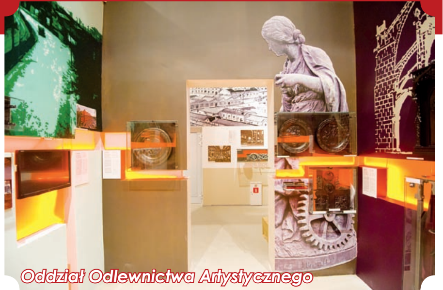
Oddział Odlewnictwa Artystycznego

W 2008 roku ponownie udostępniono dla zwiedzających Zamek Piastowski. Prace remontowe, modernizacyjne i aranżacyjne trwały niemal 3 lata! Całkowity koszt przedsięwzięcia wyniósł 3,7 mln zł (w tym 1,1 mln zł dofinansowania uzyskanego ze środków UE). Rok później Muzeum w Gliwicach zainaugurowało działalność Czytelnia Sztuki – nowego miejsca artystycznych i kulturalnych dysput. Powstało ono w specjalnie zaaranżowanej przestrzeni w piwnicach Willi Caro. Gościem pierwszego spotkania był Zbigniew Libera, jeden z najbardziej rozpoznawalnych na świecie polskich artystów współczesnych. Z kolei w październiku br. otwarto nową siedzibę Oddziału Odlewnictwa Artystycznego. Ekspozycje prezentowane dotąd w jednej z hal Gliwickich Zakładów Urzędzeń Technicznych udostępniono zwiedzającym w nowoczesnej, interaktywnej oprawie na terenie kompleksu NOWE GLIWICE przy