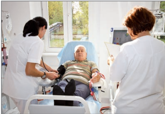
Pacjenci są teraz dializowani w nowoczesnych warunkach

– Pieniądze na nowy sprzęt medyczny warto przyznawać tym placówkom leczniczym, które skutecznie korzystają w swojej działalności z kontraktów zawartych z Narodowym Funduszem Zdrowia. Uważam, że środki finansowe dla stacji dializ mogą wręcz uchodzić za wzorcowy przykład dobrze wydanych pieniędzy. Zabiegi hemodializy są bowiem efektywnie finansowane przez NFZ. Dzięki temu poprawiamy sytuację pacjentów, ale również kondycję ekonomiczną szpitala – przekonuje Zygmunt Frankiewicz, prezydent miasta. (luz)