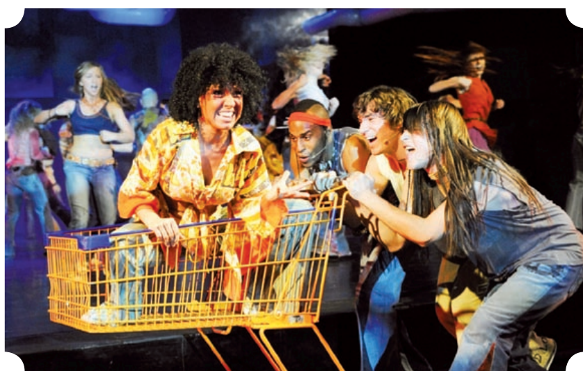
Musical „Hair” na deskach Gliwickiego Teatru Muzycznego

W Gliwicach odbywa się średnio ponad 100 imprez w miesiącu – licząc od spektakli Gliwickiego Teatru Muzycznego po lokalne wydarzenia, organizowane np. przez stowarzyszenia lub filie Biblioteki Miejskiej. Z roku na rok zwiększają się także wydatki miasta na kulturę (od 13,7 mln zł w 2006 r. do 28,7 mln zł w 2009 r.). Skąd znamy te dane? Pochodzą z mającego się wkrótce ukazać Raportu o stanie miasta 2006 – 2010. Zanim zostanie on opublikowany, przypomnimy wybrane dokonania miasta w dziedzinie kultury w latach 2006 – 2010.