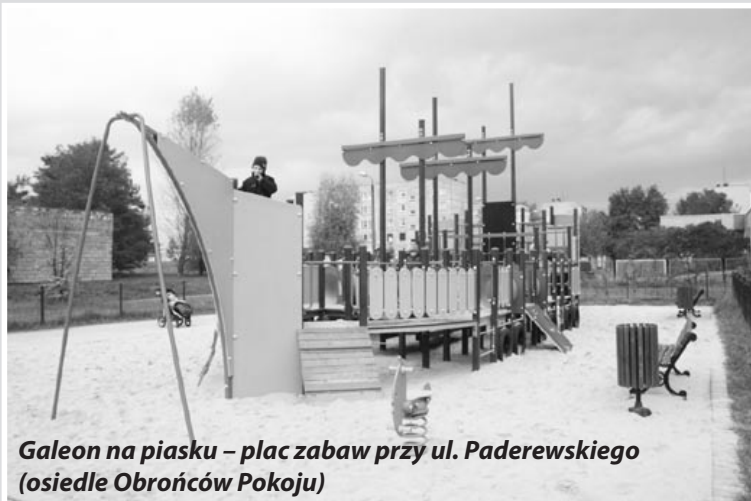
Galeon na piasku – plac zabaw przy ul. Paderewskiego (osiedle Obrońców Pokoju)