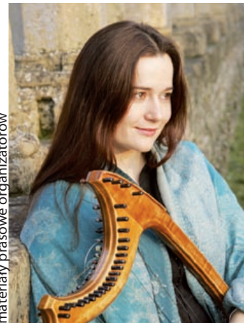
materiały prasowe organizatorów

Trwa Międzynarodowy Festiwal Muzyki Dawnej Improvizowanej ALL' IMPROVISO. Organizatorem imprezy jest Towarzystwo Kulturalne FUGA. – Podczas koncertów pragniemy zaprezentować kompozycje, w których mieszają się trzy wielkie tradycyjne kultury: chrześcijańska, żydowska i muzulmańska. W ramach wykładów i pokazów filmowych chcemy przybliżyć kulturę i historię Orientu i obu Ameryk oraz zjawisko „baroku misyjnego” – przekonują pomysłodawcy przedsięwzięcia.