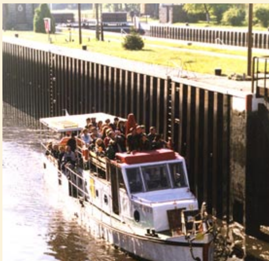
Niektórzy gliwiczanie po raz pierwszy wyruszyli w rejs po Kanale Gliwickim

Tegoroczna edycja imprezy odbyła się w sobotę i niedzielę, 18 i 19 września. Jej program z jednej strony nawiązał do zjawisk prezentowanych już podczas Dni Dziedzictwa w ubiegłym roku, z drugiej - podjął zupełnie nowe tropy badawcze. Pokazany został fenomen rozwoju miasta, jego krzeni i tego, co złożyło się na narodziny nowoczesnych Gliwic w XIX i XX wieku. Przedsięwzięcie wzbudziło bardzo duże zainteresowanie wśród gliwiczian. Ze wstępnych obliczeń wynika, że w imprezach w ramach GDDK uczestniczyło ponad 26 tysięcy osób.