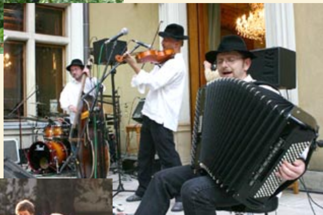
Największym wydarzeniem muzycznym okazał się koncert muzyki żydowskiej w wykonaniu zespołu KROKE

Tekst: J.Lenczowska