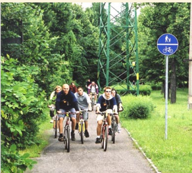
Rowerem po Gliwicach '2002

Od godz. 17.00 na Placu Krakowskim będą gromadzić się uczestnicy zlotu uczniów gliwickich szkół - dzieci i młodzież na rowerach, deskorolkach czy wrotkach. O godz. 18.00 peloton, zabezpieczony przez eskortę Straży Miejskiej i Policji, wyruszy w stronę UM. Przejedzie ulicami: Wrocławską, Częstochowską,