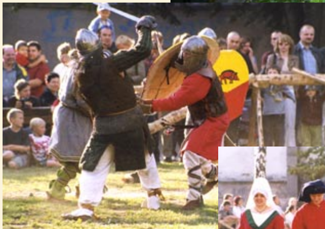
Ogromną popularnością cieszyły się - jak zwykle - walki rycerskie na przedpolu Zamku Piastowskiego

Szczególnego kolorytu dodawały imprezie postacie w strojach z dawnych epok