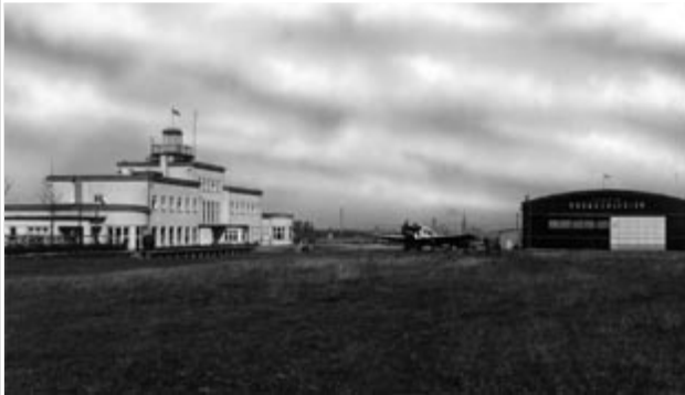
Lotnisko w Gliwicach, druga połowa lat 30-tych XX wieku

Po zakończeniu I wojny światowej mocą postanowień Konferencji w Wersalu lotnisko w Gliwicach miało zostać zniszczone. Władze wojskowe zaproponowały jednak, aby wykorzystać je dla ruchu pasażerskiego.