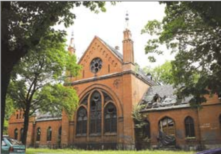
Proces dewastacji „Małej Synagogi” przy ul. Poniatowskiego 14 zostanie zahamowany

W ubiegłym miesiącu rozstrzygnięto przetarg na remont dachu „Małej Synagogi”. Do Wydziału Inwestycji i Remontów UM wpłynęły trzy oferty firm z Gliwic i Żernicy. Najkorzystniejszą propozycję przedstawił gliwicki Zakład Budowlano-Instalacyjny „ALFA”. Umowę z wyłonionym w ten sposób wykonawcą robót podpisano na początku sierpnia. Dokument określa czas trwania remontu. Prace muszą zostać ukończone w ciągu 6 miesięcy. Przedsięwzięcie będzie finansowane w całości ze środków budżetu miejskiego. Koszt zadania wyniesie 606 tys. zł brutto.