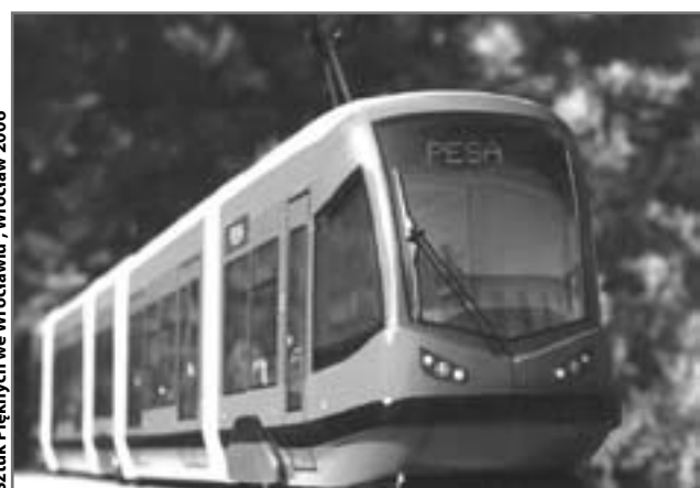
Tramwaj niskopodłogowy (2005), autorzy projektu: Włodzimierz Dolatowski, Jan Kukuła

Katalog „Rzeczy polskie. Polskie wyroby 1899-1999” wyd. BOSZ, Olsztan 2001