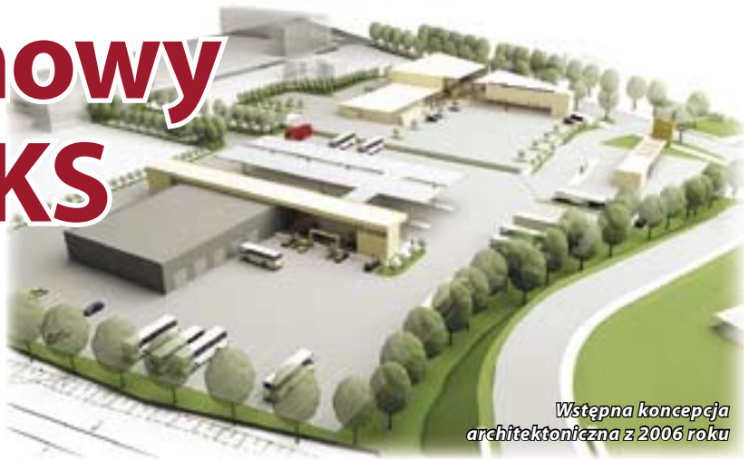
Wstępna koncepcja architektoniczna z 2006 roku

Kończy się budowa nowej stacji paliw na terenie zajezdni PKS przy ul. Toszeckiej. Jest to pierwszy etap kilkuletniego przedsięwzięcia inwestycyjnego pod nazwą „Budowa międzynarodowego dworca PKS wraz z obiektami towarzyszącymi”. Opracowana przed dwoma laty koncepcja architektoniczna przyszłego kom-