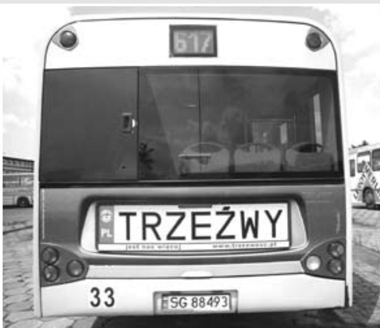
Dzięki wsparciu akcji przez Przedsiębiorstwo Komunikacji Miejskiej na ulice Gliwic wyjechały 22 autobusy z tablicą promującą ideę trzeźwości