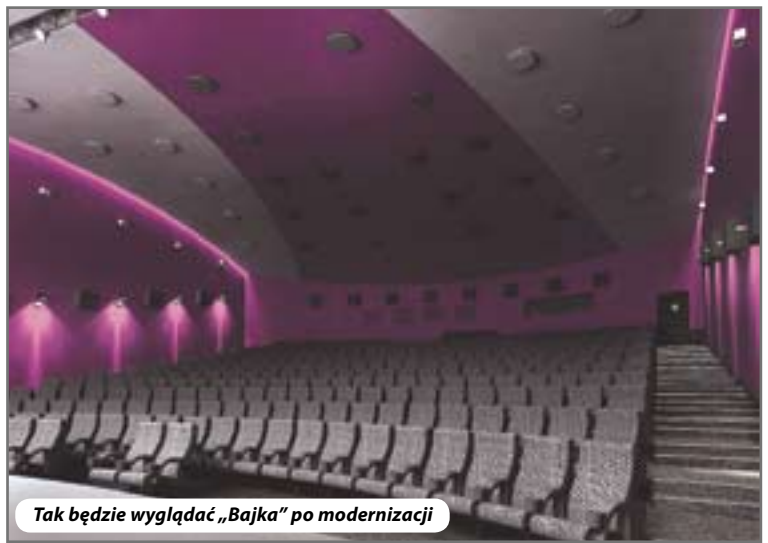
Tak będzie wyglądać „Bajka” po modernizacji

„DIVAL”. Podpisana umowa przewiduje ukończenie robót do 30 grudnia br. Wykonawca powinien uporać się nie tylko z ułożeniem nowego dachu, ale i z wieloma innymi pracami budowlanymi, instalacyjnymi, wykończeniowymi i kinotechnicznymi. Przedsięwzięcie będzie kosztować ok. 7 mln zł – wyjaśnia Grzegorz Krawczyk, zastępca dyrektora GTM.