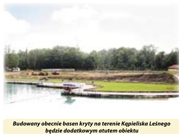
Budowany obecnie basen kryty na terenie Kąpieliska Leśnego będzie dodatkowym atutem obiektu