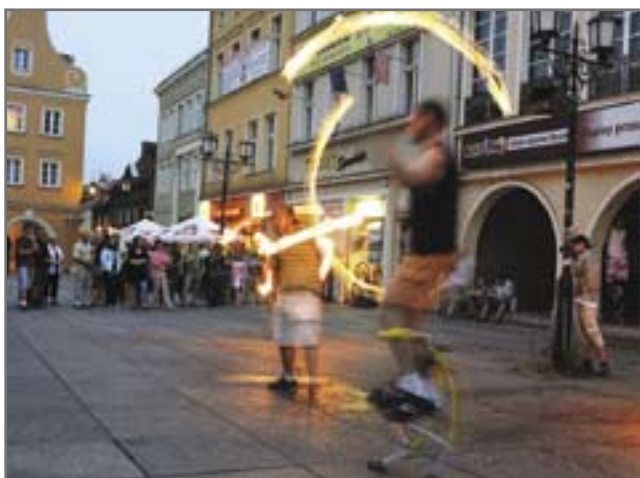
Pierwszy weekend sierpnia – Fire & Drums Day