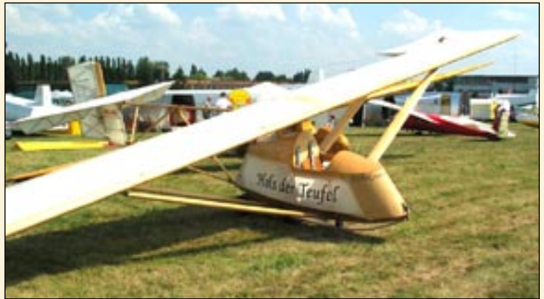
fol. A. Włtwicki

Prawdziwą ozdobą zlotu jest replika słynnego szybowca HOLS DER TEUFEL z 1926 roku