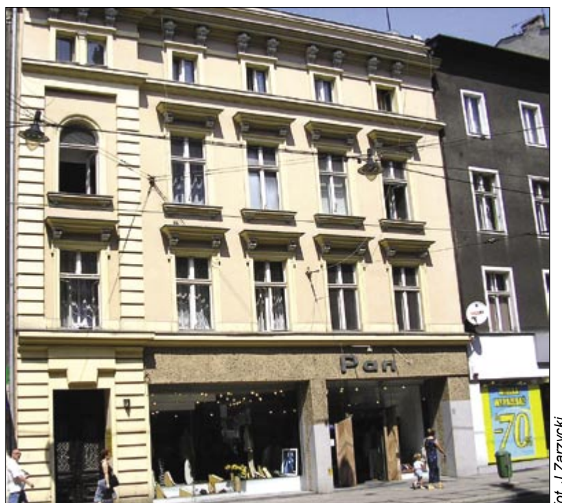
fol. J. Zarzycki

Tak prezentuje się odnowiona kamienica przy ul. Zwycięstwa 27