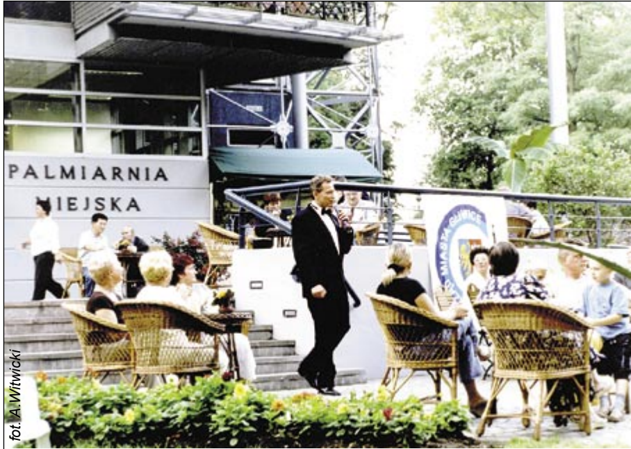
Jedną z gwiazd ubiegłorocznego „Parkowego lata” w Gliwicach był śpiewający aktor Jacek Borkowski

W sierpniowe soboty w Parku Chopina obok Palmiarni Miejskiej będą organizowane – wzorem ubiegłego roku - nastrojowe koncerty plenerowe. Program kameralnych imprez pod wspólnym tytułem „Parkowe lato” wypełni przyjemna dla ucha i sprzyjająca relaksowi muzyka rozrywkowa w wykonaniu znanych i popularnych artystów teatralnych oraz piosenkarzy.