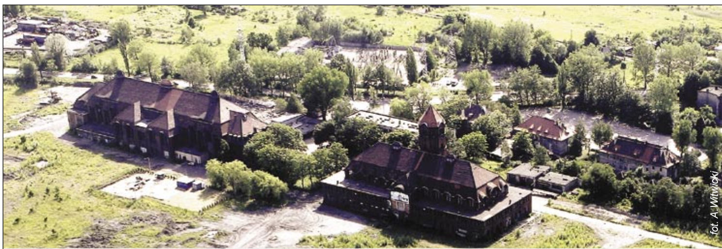
fol. A. Wtewicki

Wieloletnie starania gliwickiego samorządu o uruchomienie w naszym mieście kolejnej wyższej uczelni zakończyły się sukcesem. Minister Edukacji Narodowej i Sportu wydał decyzję pozwalającą na utworzenie niepaństwowej wyższej szkoły zawodowej pod nazwą Gliwicka Wyższa Szkoła Przedsiębiorczości i prowadzenie studiów na kierunku „Ekonomia” w specjalnościach: „finanse i rachunkowość” oraz „gospodarowanie zasobami pracy”. Pierwsi studenci powinni rozpocząć naukę już w październiku tego roku. Przygotowano dla nich nie tylko atrakcyjną ofertę kształcenia. Po zakończeniu nauki mogą liczyć na pomoc przy podejmowaniu pierwszej pracy. dokończenie na str. 3