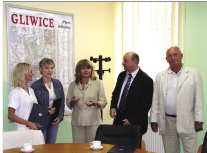
fol. M. Kopeć

wającej pomocy. Wiedziały jedynie, że dzwoniący mężczyzna źle się poczuł i chce wezwać karetkę. Niestety - jak domyśliły się po docierających odgłosach upadającej słuchawki - zemdał i nie zdążył podać informacji o miejscu zamieszkania. Panie odczytały numer telefonu, ale