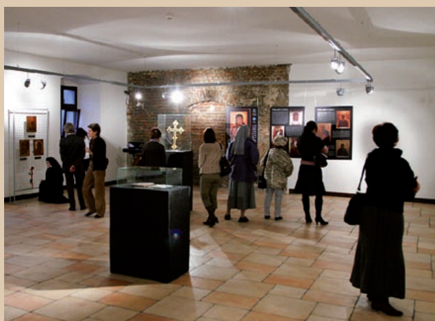
fol. W. Turkowski

Ikony to dzieła szczególne, budzące zainteresowanie, podziw i ciekawość. W zbiorach gliwickiej placówki znajduje się dwadzieścia sześć takich obrazów. W większości są to obiekty ocalone przed próbą ich nielegalnego wywozu za granicę w celach handlowych. Zbiór stanowią głównie ikony pochodzące z Rosji. Kolekcja jest zróżnicowana warsztatowo, stylistycznie i tematycznie. Dzieła powstawały w pracowniach nieznanych autorów w XIX wieku i na początku minionego stulecia. W kolekcji dominują wi-