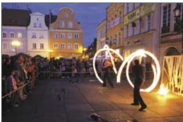
Grupa kuglarska ASOCJACJA zaprezentowała w minioną sobotę FIRE-SHOW.

Jeśli nie kino, to może koncert lub teatr? W sobotę, 12 lipca, o godz. 21.00 na Rynku będzie można usłyszeć muzykę ŻYWIOLAŁAKA. To wypadkowa takich stylów, jak folk, punk,