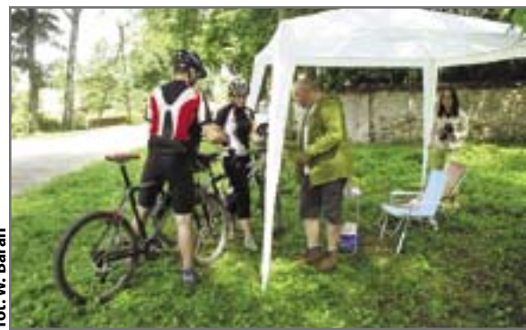
fol. W. Baran