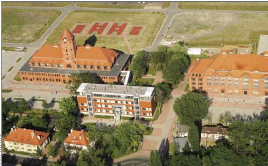
fol. A. Witwicki