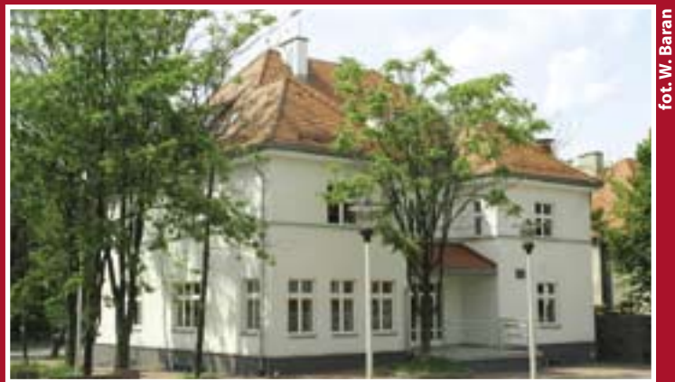
fol. W. Baran