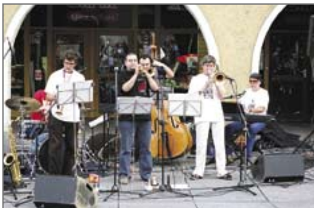
6 lipca przed gliwiczaniem wystąpiła formacja muzyczna ENERJAZZER.

rockmetal, akustyczne trans-techno czy drum'n'bass. Pojawiają się w niej także elementy muzyki dub, chillout czy ambient, a spajają charakterystyczne brzmienie zrekonstruowanych instrumentów dawnych „wynalazków” techniki nowszej oraz archaicznych i współczesnych technik wokalnych.