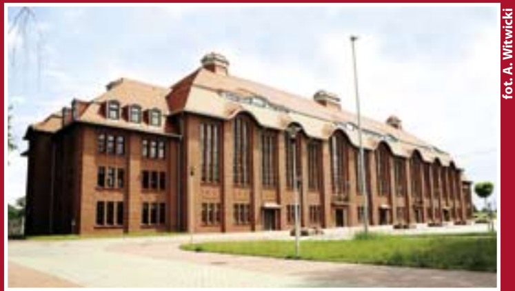
fol. A. Witwicki