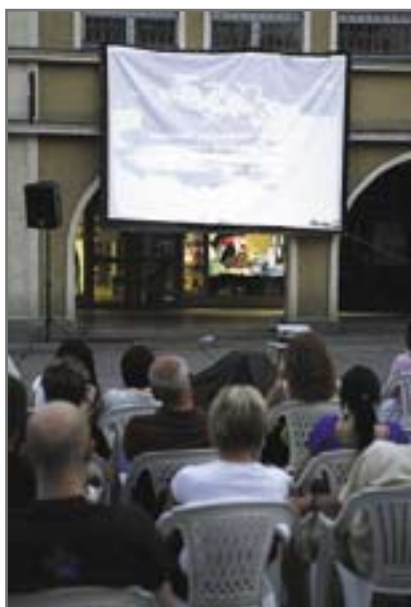
W pierwszy czwartek miesiąca na Rynku zorganizowano pokaz „Guzikowców” – czarnej komedii z 1997 r., wyreżyserowanej przez Petra Zelenkę.