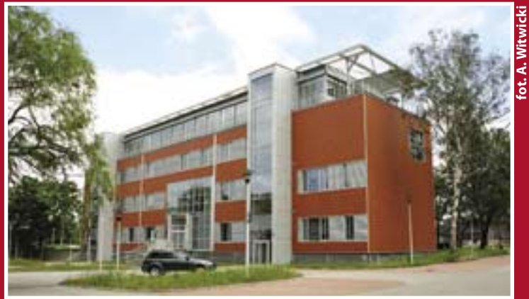
fol. A. Witwicki