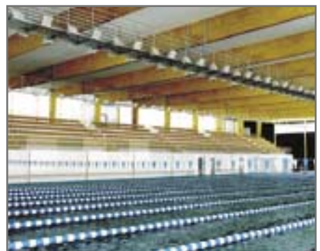
wizualizacja: DiG Sowiński Architekci

Miesa van der Rohe w okresie międzywojnia i pokazany przez Niemcy na wystawie międzynarodowej w 1929 roku.