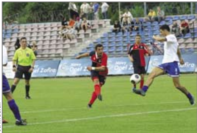
fol. W. Baran

Informacje o wszystkich wakacyjnych imprezach można znaleźć w filiach MBP oraz na stronie internetowej www.biblioteka.gliwice.pl .