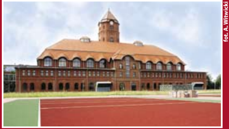
fol. A. Witwicki