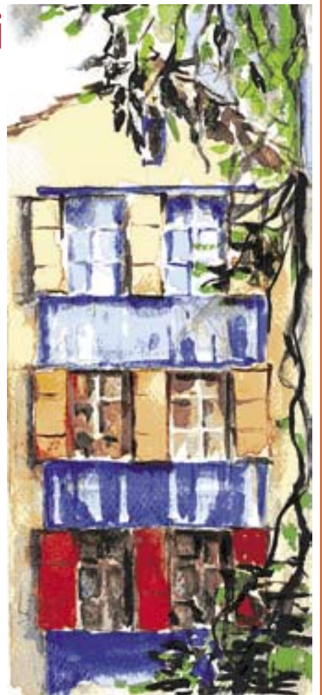
praca E. Pokorskiej

Do poprzedniego odcinka cyklu, dotyczącego Zabytkowej Kopalni Węgla Kamiennego „Guido” w Zabrzcu, wkradł się błąd. Na niebiesko pomalowana jest wieża szybu „Kolejowy”, a nie budynek nadszybia.