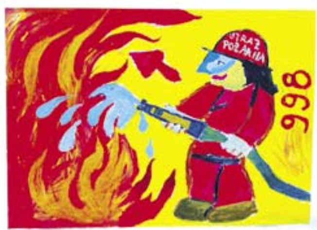
praca Adama Pilichowicza (10 lat)

Miejska Biblioteka Publiczna zachęca do oglądania kolejnych wystaw w filiach MBP na terenie miasta. W Bibliotece przy pl. Inwalidów Wojennych do końca sierpnia otwarta będzie ekspozycja „Kiedy dzwonię po straż pożarną?” Zgromadzono na niej prace dzieci i młodzieży zgłoszone do IX edycji Ogólnopolskiego Konkursu Plastycznego (w ramach eliminacji miejskich). Rywalizację w Gliwicach zorganizował Urząd Miejski wspólnie ze Szkołą Podstawową nr 3.