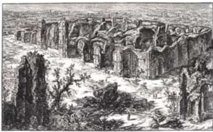
Giambattista Piranesi, „Rovine delle Terme Antoniniane...” (Ruiny Term Antoniuszy, Rzym). Cykl „Vedute di Roma” po 1740 roku, akwaforta na papierze żeberkowym 42x69 cm

Malarsko, subtelnie traktowane akwaforty Piranesiego były chętnie gromadzone przez mecenasów sztuki, galerie, gabinety rycin, biblioteki i muzea. W zbiorach Muzeum w Gliwicach znalazło się 138 dzieł artysty, pochodzących głównie z cykli „Le Antichità Romane” i „Vedute di Roma”. Kolekcja ta nie ma charakteru przypadkowego zbioru. Można wskazać bowiem na pewne cechy wspólne prac, widoczne w ich formie i tematyce. Dominuje Rzym antyczny z jego melancholijnym pięknem i monumentalnymi relikami. Wystawa będzie udostępniana w Brzegu do 29 lipca. Towarzyszy jej katalog, zawierający prezentacje najbardziej charakterystycznych reprodukcji oraz płyta CD z pełnym wykazem fotograficznym wszystkich akwafort Włocha przechowywanych w zbiorach Muzeum w Gliwicach. (kik)