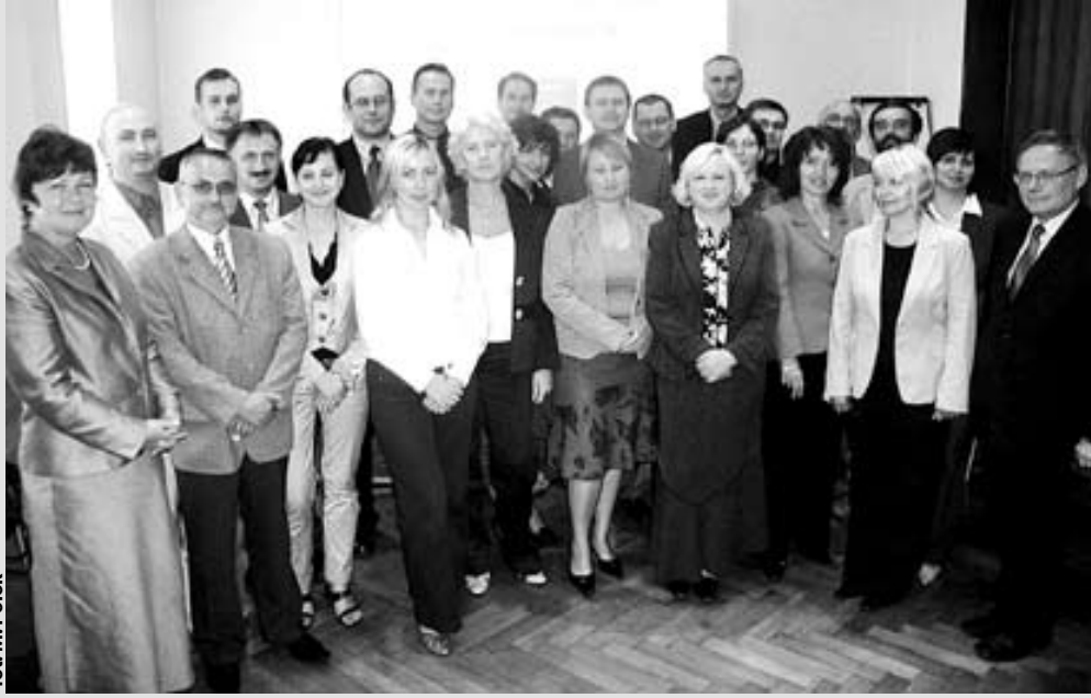
fol. M. Polok

To pytanie z puli nie najłatwiejszych, lecz odpowiedzi na nie poszukują już regionalne instytucje, które w ubiegły wtorek podpisały porozumienie o współpracy w ramach Śląskiej Sieci Inkubatorów, Parków Przemysłowych i Technologicznych. W gliwickim magistracie zwieńczono w ten sposób prace jednej z czterech grup tematycznych działających pod auspicjami Sieci Efektywnej Komerccjalizacji Technologii SEKT.