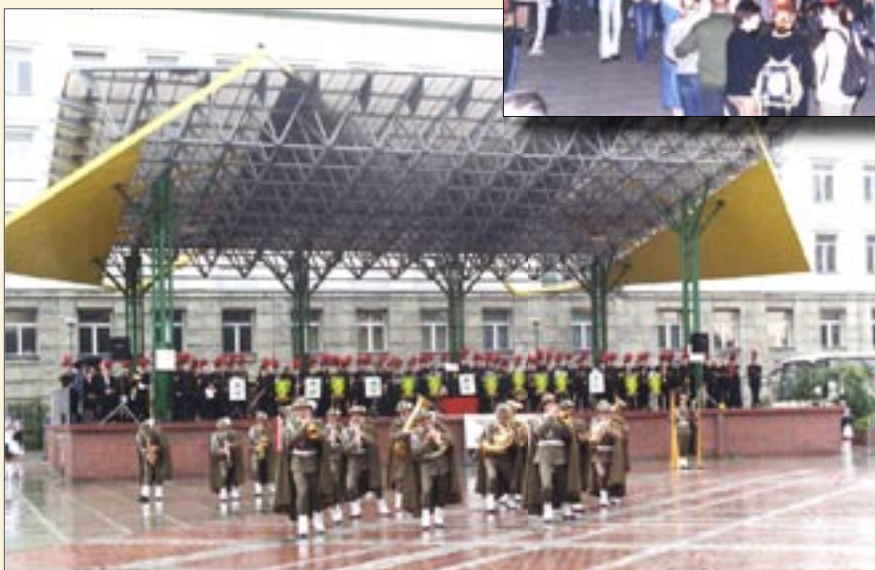
fol. E. Kaliszewska