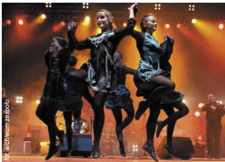
fol. archiwum zespołu

Impresariat Gliwickiego Teatru Muzycznego i gliwicki samorząd zapraszają mieszkańców miasta na doroczną imprezę plenerową na placu Krakowskim - Noc Świętojańska. Jej organizatorzy zamierzają - podobnie jak w latach ubiegłych - skorzystać z bogatej tradycji obrzędów Sobótki.