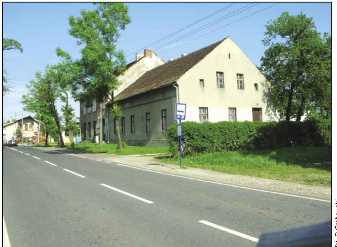
Zabytkowy budynek dawnej szkoły z 1872 roku jest obecnie siedzibą Kółka Rolniczego, Rady Osiedlowej Czechowice i Stowarzyszenia Rozwoju Czechowic