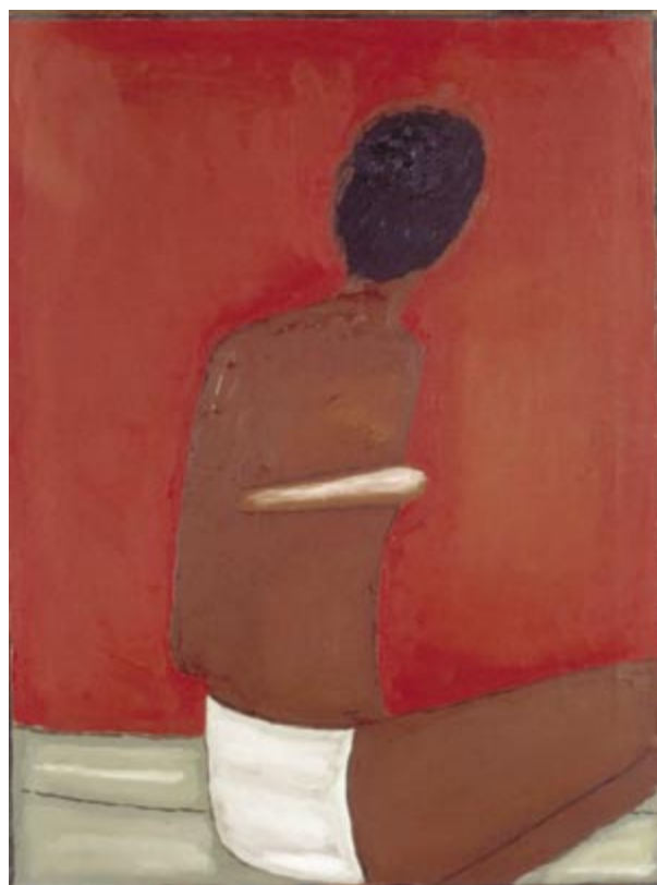
ze zbiorów Muzeum Narodowego w Krakowie

W twórczości Jerzego Nowosielskiego dominuje fascynacja ikoną ruską, która rozpoczęła się już około 1937 roku. Towarzyszyła artyście także wtedy, gdy korzystał z doświadczeń sztuki europejskiej XX wieku - abstrakcji, surrealizmu, a także sztuki naiwnej. Choć „Akt” jest jednym z wielu syntetycznych spojrzeń na kobiece ciało, przy sięganiu do tej tematyki artysta także nie zrezygnował z duchowego wpływu sztuki ikony. Nowosielski tłumaczy „(...) pełna synteza spraw duchowych z rzeczywistością empiryczną dokonuje się właśnie w postaci kobiety (...) jeżeli malarza interesuje problem cielesności, jakiś sposób łączenia spraw duchowych ze światem bytów fizycznych, to zupełnie naturalne jest, że zaczyna się interesować wyglądem kobiety”. (al)