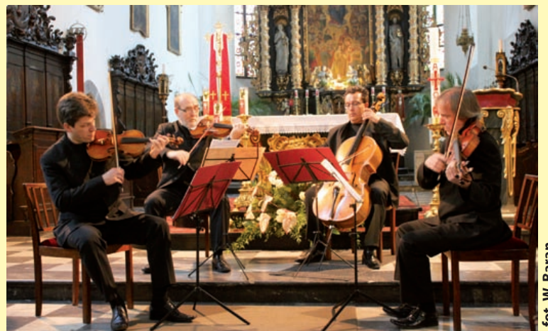
fol. W. Baran