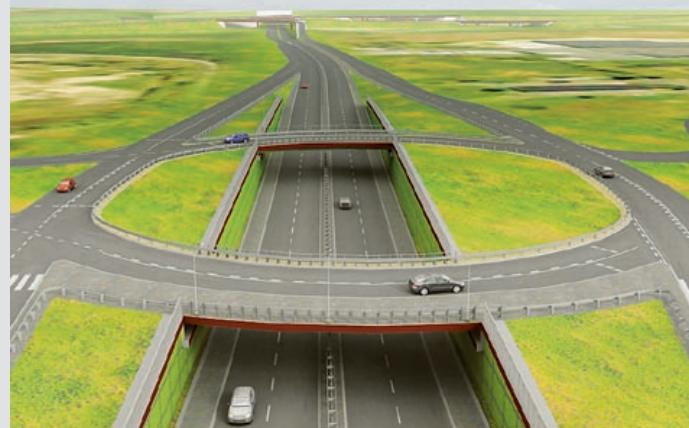
materiały prasowe GDDKiA

Przypomnijmy, że od zimy obowiązuje zmieniona organizacja ruchu pojazdów przemieszczających się do ul. Pszczyńskiej. W bezpośrednim sąsiedztwie budowanego węzła A1 – A4 mogą nią przejeżdżać wyłącznie autobusy komunikacji miejskiej i pojazdy uprawnione – w tym samochody dojeżdżające do firm zlokalizowanych w pobliżu ul. Pszczyńskiej i Okrężnej. Dla pozostałych kierowców zostały wyznaczone objazdy prowadzące przez węzły autostradowe w Bojkowie i Ostropie (samochody osobowe) oraz Kleszczowie (samochody ciężarowe). Mieszkańcy Gliwic i okolic mogą skorzystać dodatkowo m.in. ze skrótu ulicami: Bojkowską – Rolników – Graniczną – Pszczyńską – Gliwicką w obrębie Przyszowic.