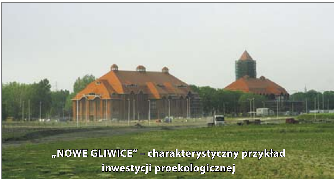
„NOWE GLIWICE” – charakterystyczny przykład inwestycji proekologicznej

Publikacja dofinansowana ze środków Wojewódzkiego Funduszu Ochrony Środowiska i Gospodarki Wodnej w Katowicach