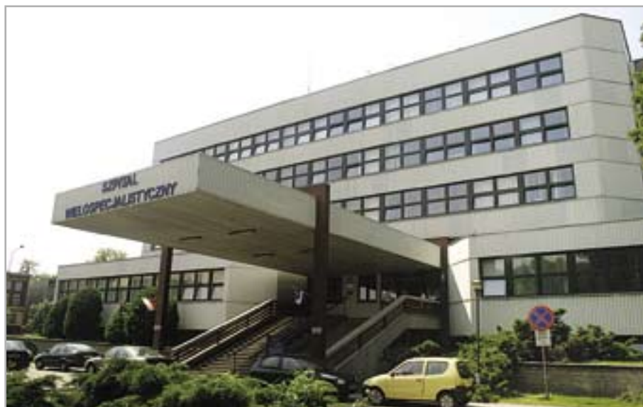
Szpital Wielospecjalistyczny – ul. Kościuszki 1, liczba łóżek – 152, oddziały: ginekologii i położnictwa, fizjologii i patologii ciąży, okulistyki, laryngologii