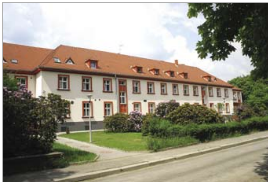
Zespół Szpitali nr 2 - ul. Radiowa 2, ul. Kozielska 8, liczba łóżek – 133, oddziały: chorób wewnętrznych i neurologii oraz zakład opiekuńczo-leczniczy

Renata Caban: Podjęwając decyzję o restrukturyzacji szpitali brano pod uwagę ich sytuację finansową. Likwidacja dotychczasowych placówek w celu utworzenia na ich miejscu niepublicznych zakładów opieki zdrowotnej była podyktowana przede wszystkim chęcią uzdrowienia szpitalnych finansów. Poszczególne likwidatorzy podejmowali rozmaite działania, by poprawić kondycję ekonomiczną szpitali. Przyniosło to oczekiwany skutek. Szpitale wyszły już na prostą, jak to się mówi w sportowym języku. Za kilka tygodni rozpoczną pracę w nowym kształcie organizacyjnym. Będą już placówkami prywatnymi, podobnie jak to się stało przed sześcioma laty z gliwickimi przychodniami. Pacjenci z pewnością odczują korzyści z tego tytułu. Można przypuszczać, że będzie im lepiej w szpitalach prywatnych, niż w publicznych. Takie zjawisko występuje przecież na całym świecie i nie powinno nikogo dziwić. Pacjenci gliwickich szpitali nie będą musieli ponosić żadnych opłat za leczenie.