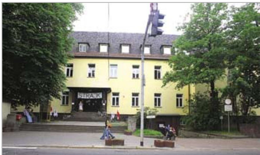
Szpital nr 1 – ul. Kościuszki 29, liczba łóżek – 322, oddziały: chorób wewnętrznych, kardiologii, pediatrii, chirurgii, urologii

Na drodze do pełnego sukcesu w procesie przeobrażeń szpitali stanęły jednak przeszkody formalne. Brakowało nowego rozporządzenia ministra zdrowia w sprawie warunków technicznych budynków szpitali. 10 listopada 2006 roku prof. Zbigniew Religa podpisał wreszcie oczekiwany dokument. Otworzyło to drogę do zakończenia zaplanowanych przekształceń i rejestracji nowych zakładów opieki zdrowotnej. Za kilka tygodni będzie można w Gliwicach ostatecznie oddłużyć szpitale, dzięki czemu nowe zakłady rozpoczną działalność bez obciążeń spowodowanych starymi długami. O dobiegającej końca prawie trzyletniej operacji przekształcania organizacyjnego szpitali rozmawiamy z Renatą CABAN – zastępcą prezydenta miasta i Lucyną WOŹNIAK – naczelnikiem Wydziału Zdrowia i Spraw Społecznych UM.