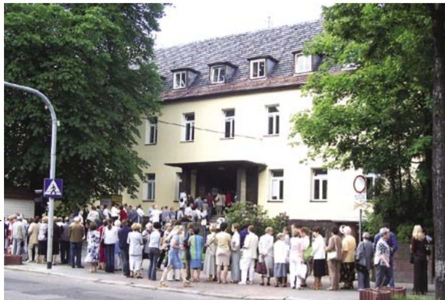
W niedzielę lekarze w poradniach przyszpitalnych udzielili łącznie 474 porad. W szpitalnym laboratorium wykonano zaś 930 badań diagnostycznych (morfologia, poziom cukru i cholesterolu we krwi)

Porad udzielali urologi, nefrologi, kardiolog, specjaliści chorób wewnętrznych, pediatry oraz chirurdzy. Zainteresowani mieszkańcy miasta mogli nieodpłatnie zmierzyć poziom cholesterolu i cukru we krwi, a także wykonać badania morfologiczne i badania USG jamy brzusznej, tarczycy, piersi i kolan, badania ciśnienia tętniczego oraz EKG.