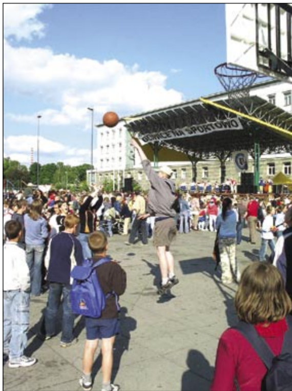
Podczas finału na Placu Krakowskim gliwiczanie mieli okazję włączyć się do sportowej rywalizacji – wystarczyło trochę poćwiczyć i zdobyć kolejne punkty dla miasta

Gliwice zajęły drugie miejsce na Śląsku i czwarte w Polsce w Sportowym Turnieju Miast i Gmin w grupie miast o liczbie mieszkańców powyżej 100 tysięcy. Celem imprezy była popularyzacja sportu w różnych kręgach i środowiskach społecznych. Turniej przygotowała Krajowa Federacja Sportu dla Wszystkich, działając z inicjatywy Ministerstwa Edukacji Narodowej i Sportu. Przedsięwzięcie w Gliwicach koordynował lokalny samorząd.