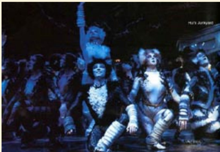
londyńska obsada „Kotów”