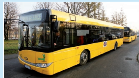
fol. A. Witwicki

Co – zdaniem prezydenta – warto wiedzieć o autobusach? Można je wprowadzić na trasę przebiegu „jedynki” i „czwórki” bez większych przeszkód. Mają to być pojazdy nowoczesne i – co najważniejsze – niskopodłogowe. Powinny kursować z podobną częstotliwością, co tramwaje, a przystanki mają znajdować się mniej więcej tam, gdzie obecnie. Do komunikacji publicznej zawsze trzeba dopłacać, ale eksploatacja autobusów jest o połowę tańsza niż tramwajów. Po zastąpieniu tramwajów autobusami w budżecie miejskim może zostawać rocznie co najmniej 2 mln zł.