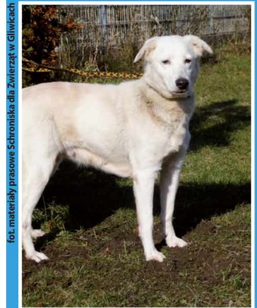
MISIA – 2-letnią, dużą, łagodną i wysterylizowaną suczką, która nadaje się tak do mieszkania, jak i domu z ogródkiem.