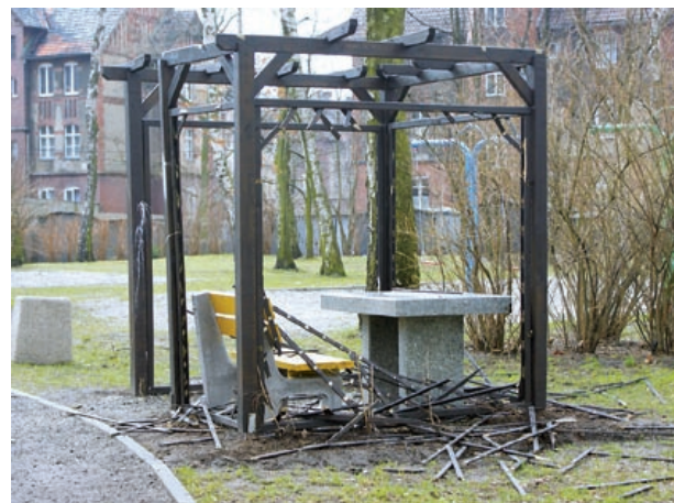
Zniszczony „kącik” dla mam z dziećmi przy ul. Horsta Bienka

Ostatnio łupem nieznanymi sprawców padły również ozdobne rośliny na Skwerze Dessau. Jesienią ubiegłego roku plac w sąsiedztwie Katedry zyskał nowe oblicze. Przez kilka miesięcy ubiegłego roku prowadzono na nim zakrojone na szeroką skalę prace modernizacyjne. Wśród nowo posadzonych roślin pojawiło się skupisko 5 różaneczników. Niestety, podczas oględzin miejskich skwerów przeprowadzonych na początku miesiąca pracownicy MZUK zauważyli, że krzewy zostały wyrwane i skradzione. – Po pięknych roślinkach, które wiosną obsypane są różnokolorowymi kwiatami, pozostał jedynie pusty teren wysypany korą – relacjonuje rzeczniczka MZUK.