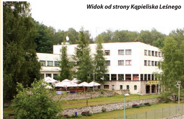
Widok od strony Kąpieliska Leśnego

13 lipca 2009 r. o godzinie 11.00 w siedzibie Urzędu Miejskiego w Gliwicach przy ul. Zwycięstwa 21, w sali nr 136, odbędzie się II ustny przetarg nieograniczony na zbycie (na własność) nieruchomości zabudowanej – działka nr 5, obręb Kopernik, KW GL1G/00037956/1 „Leśny centrum konferencyjno-wypoczynkowe” położonej przy ul. Toszeckiej 137 oraz nieruchomości niezabudowanej – działka nr 6, obręb Kopernik, KW GL1G/00031891/5 położonej na zachód od ul. Toszeckiej.