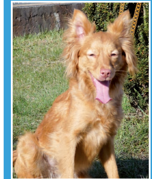
TOSIA – małą i wysterylizowaną suczką, około 1,5-roczną. To „żywe srebro”, doskonały kompan na długie spacery.

Schronisko dla Zwierząt organizuje adopcje od poniedziałku do piątku, w godz. od 10.00 do 16.00 i w soboty od 10.00 do 15.00. Wydawane zwierzęta są zaszczepione, wysterylizowane i przyjaźnie nastawione do ludzi.