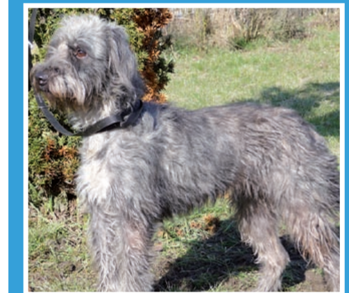
PUSIA – 2-letnią suczką średniej wielkości, wysterylizowaną, domową i bardzo łagodną.