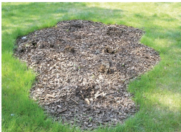
Ze Skweru Dessau skradziono ozdobne krzewy

Apelujemy – kiedy zobaczysz osoby, które dewastują miejską zielenie czy obiekty użyteczności publicznej – nie bądź obojętny! Zwróć uwagę wandalom lub niezwłocznie zaalarmuj odpowiednie służby (Policję lub Straż Miejską). (bom)