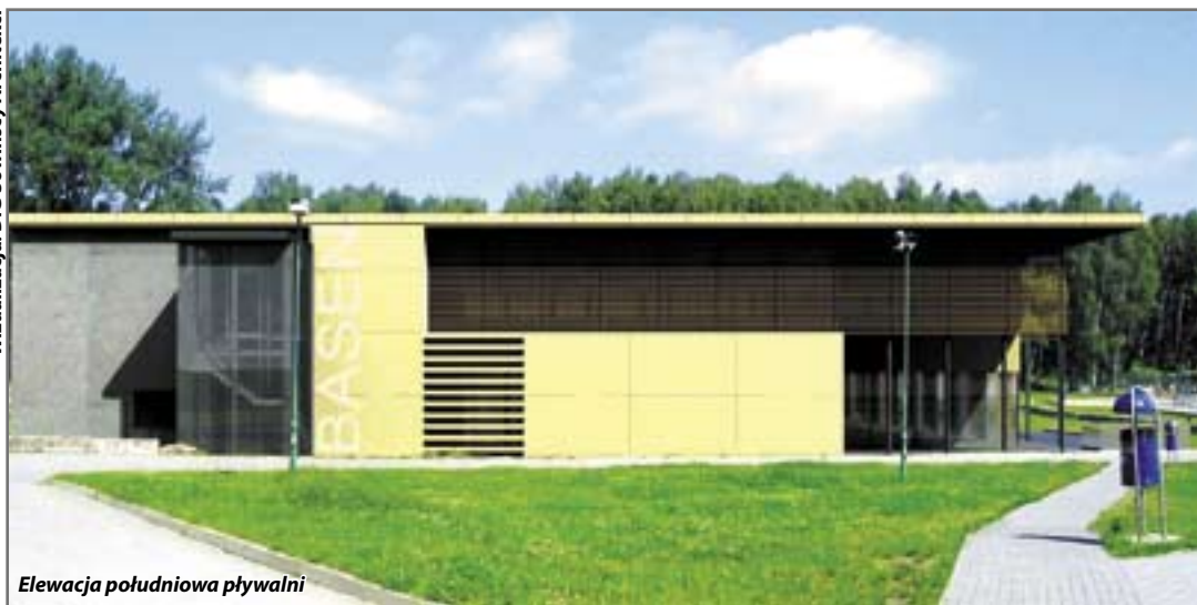
Elewacja południowa pływalni

Od południowej strony obiektu ciągnąć się ma hol wejściowy z niewielkim barkiem oraz szatnią, powstanie również przeszklona klatka schodowa i niezbędne pomieszczenia biurowe. W holu głównym (w podcieniu antresoli) przewidziano kolejną atrakcję – panoramiczne przeszklenia, które otworzą widok na wnętrze pływalni. Warto podkreślić, że aby doświetlić wszystkie pomieszczenia, zaprojektowano przeszklenie całej kondygnacji piętra holu. Dla komfortu pływaków korzystających z kąpeli w godzinach południowych i popołudniowych pomyślano również – jak już wcześniej wspomniano – o drewnianych żaluzjach poziomych, osłoniętych mocno wysuniętym dachem.