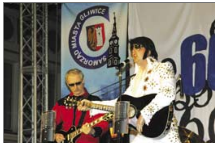
W przerwach pomiędzy walkami śpiewał... Elvis Presley z Pragi!