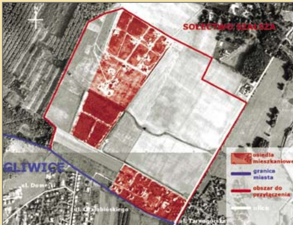
Ankieta dostępna także na stronie www.um.gliwice.pl

Wypełnioną ankietę należy wrzucić do urny znajdującej się w Biurze Obsługi Interesantów na parterze Urzędu Miejskiego w Gliwicach, wysłać pocztą elektroniczną na adres: bp@um.gliwice.pl albo pocztą zwykłą na adres: Urząd Miejski w Gliwicach, Biuro Prezydenta Miasta i Rady Miejskiej, ul. Zwycięstwa 21, 44-100 Gliwice do 7 lipca 2008 r.