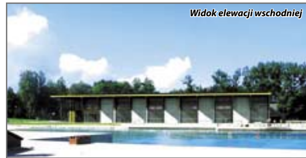
Widok elewacji wschodniej

Na tym się jednak nie skończyło, ponieważ dwie firmy zdecydowały się wystąpić do Krajowej Izby Odwoławczej w Warszawie działającej przy Prezesie Urzędu Zamówień Publicznych. Złożyły odwołania od rozstrzygnięcia protestów przez zamawiającego. Decydujące w tej sprawie posiedzenie KIO wyznaczono na 13 maja w godzinach przedpołudniowych. (kik)