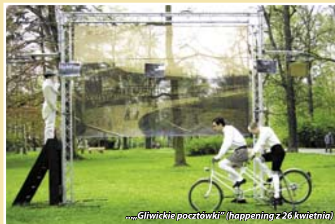
...„Gliwickie pocztówki” (happening z 26 kwietnia)

Będzie to druga impreza z zaplanowanego na 2008 rok cyklu parahistorycznych wydarzeń plenerowych Teatru „A”. Jej szczegóły mają być omawiane na bieżąco na stronie http://teatr-a.art.pl/retrospekcie . (kik)