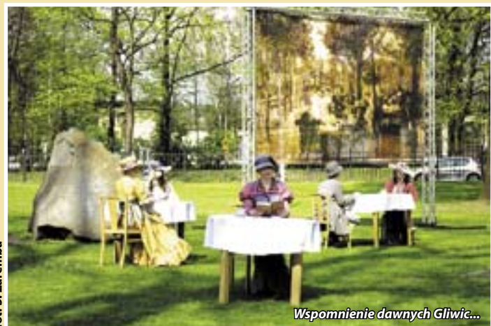
Wspomnienie dawnych Gliwic...

Teatr „A” wespół z samorządem miasta zapraszają gliwiczian na kolejny retro-happening, aranżowany tym razem na moście nad rzeką przy ul. Zwycięstwa. Naturalistyczne obrazy popołudniowej rekreacji mieszkańców sprzed lat – i nie tylko! – będzie można podziwiać w sobotę, 24 maja, tuż po godz. 12.00. „Reanimacja Kłodnicy” potrwa 2 godziny.