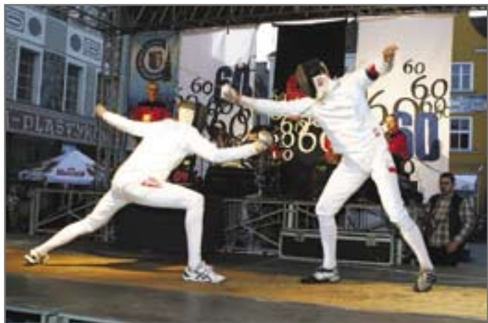
2 maja w scenarii gliwickiego Rynku nasi szpadziści rozegrali mecz pokazowy „Piaś” kontra „Reszta Świata”. Goście padli „piastunom” do stóp (zwycięstwo 3:1)