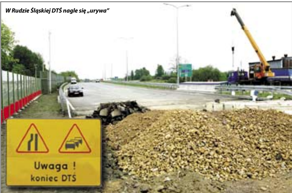
W Rudzie Śląskiej DTŚ nagle się „urywa”

Drogowa Trasa Średnicowa ma do 2012 roku połączyć Katowice z Gliwicami. Takie są plany. Na razie ze stolicy województwa można dojechać „średnicówką” jedynie do Rudy Śląskiej. Tam kończy się kolejny etap inwestycji. Następny obejmuje odcinki zlokalizowane na terenie Zabrze i Gliwic. U naszych sąsiadów lada chwila mają ruszyć prace budowlane. Tymczasem niespodziewanie zmieniono zasady finansowania przedsięwzięcia. Komisja Wspólna Rządu i Samorządu Terytorialnego postanowiła, że do DTŚ powinny dopłacić także samorządy (w części obejmującej rządową subwencję). – Ta decyzja ogromnie nas zaskoczyła. Zostaliśmy postawieni w sytuacji bez wyjścia. Albo wyasygnujemy część pieniędzy, albo nie będzie u nas DTŚ. Wyłożymy więc pieniądze, bo bardzo zależy nam na powstaniu tej drogi – mówi prezydent Gliwic.