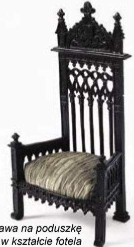
Oprawa na poduszkę do igieł w kształcie fotela

Szczególnie godne uwagi są obiekty dotychczas nie pokazywane - zarówno te, które poddane zostały gruntownej konserwacji, jak i te, które wzbogaciły zbiory muzeum na przestrzeni ostatnich lat. Kolekcja odlewów artystycznych jest bowiem stale uzupełniana o nowe eksponaty. Na wystawie znajdują się także transpozycje znanych dzieł malarskich, takich jak „Ostatnia wieczerza” wg obrazu Leonardo da Vinci, pokazana zostanie misterna biżuteria żeliwna odlewana w Gliwicach w XIX wieku oraz tzw. galanteria - stojaki na zegarki, przyciski do papieru, kałamarze, świeczniki, oprawy na lustra, wieszaki na biżuterię. Będzie można poznać także technologię powstawania odlewów. Osobną grupę eksponatów stanowią będą miniaturowe pomniki, m.in. Fryderyka Wilhelma III czy Napoleona. Dla kontrastu i porównania zostaną zaprezentowane obiekty, które powstały w latach międzywojennych czyli drugim okresie świetności gliwickiej odlewni.