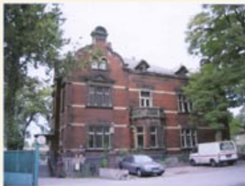
fol. B. Pizof

Osoba, która wygra przetarg, zobowiązana będzie do poniesienia kosztów notarialnych i sądowych związanych z nabyciem nieruchomości lokalowej. Dodatkowych informacji na temat warunków przetargu udziela Biuro Obsługi Interesantów, stanowisko ds. zamówień publicznych i przetargów, tel. 239-12-56.