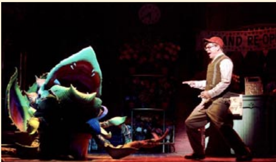
Sklepik ... na Broadwayu

Nicholson grał w filmie masochistę-pacjenta sadystycznego dentysty, chłopaka Audrey. Jako masochista, uwielbiał wizyty u stomatologa. Zażądał nawet od niego wyrwania wszystkich zębów!