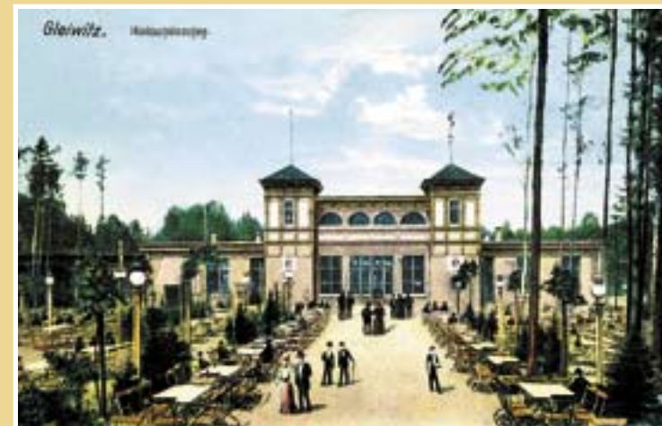
Pocztówka z 1908 r.

W 2004 roku doszło do zmiany dzierżawcy nieruchomości. Został nim prywatny przedsiębiorca z Krzyżanowic. Po raz kolejny przebudował obiekt, ale nadal działała w nim dyskoteka. Po dwóch latach zrezygnował jednak z prowadzenia interesu w Gliwicach. Pojawiły się też kłopoty techniczne. Na początku grudnia 2006 roku dzierżawca nieruchomości powiadomił Powiatowy Inspektorat Nadzoru Budowlanego o złym stanie technicznym dachu budynku. Wydano polecenie niezwłocznego zamknięcia obiektu. Od ponad 17 miesięcy obiekt nie ma gospodarza z prawdziwego zdarzenia.