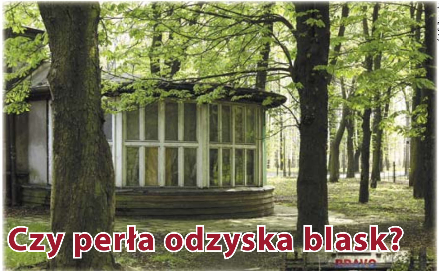
fol. S. Zaremba