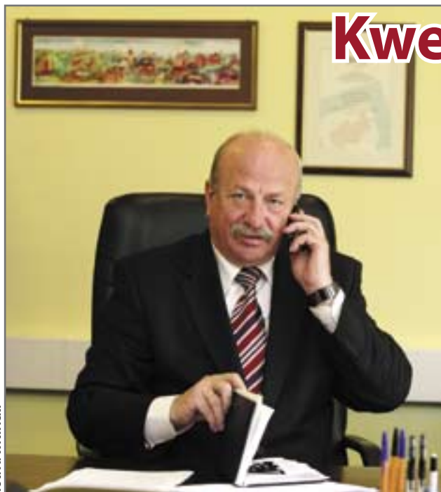
fol. A. Włtwicki

W XIX stuleciu wśród bywalców europejskich salonów krążył słynny Kwestionariusz Prousta – zestaw dwudziestu pytań określających przymioty charakteru i stosunek do otaczającego świata osób ankietowanych. Dwa razy wypełniał go sam Marcel Proust, autor m.in. wielotomowej powieści „W poszukiwaniu straconego czasu”. Zakładał on, iż odpowiedzi na postawione pytania powinny być przede wszystkim przemyślane i możliwie najbardziej zwięzłe. Z czasem jego pomysł zaczęli powielać cenieni publicyści i znani dziennikarze.