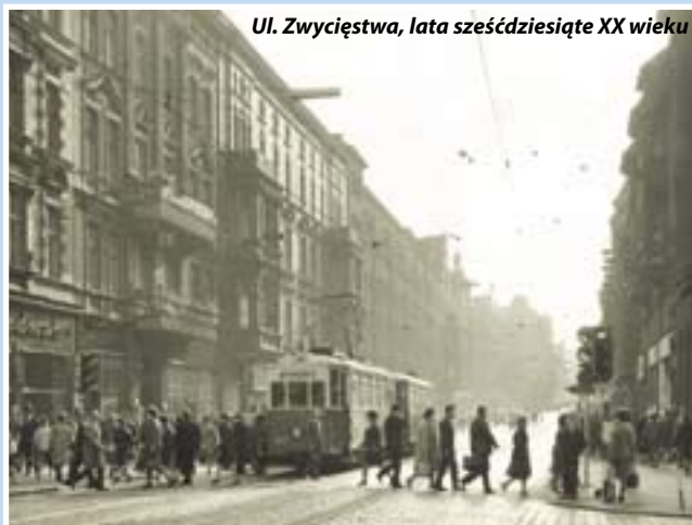
Ul. Zwycięstwa, lata sześćdziesiąte XX wieku

Pierwsza szkoła „tysiąclatka”, małe „m” w punktowcach na osiedlu Sikornik, rozbudowa kampusu Politechniki Śląskiej, ciastka w „Agawie”... W tle – polityka I sekretarza KC PZPR Władysława Gomułki. Muzeum w Gliwicach powraca do okresu małej stabilizacji lat 1956-1970. Wystawa czasowa pod tym samym tytułem (prezentowana od 22 kwietnia w zabytkowych wnętrzach Willi Caro) pozwala uzmysłowić młodszym generacjom, jak funkcjonowało nasze miasto w drugiej i trzeciej dekadzie po zakończeniu II wojny światowej.