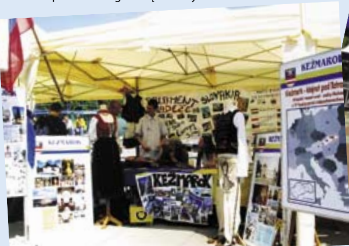
fol. A. Witwicki

Zaproszone grupy będą przebywać w naszym mieście od 6 do 10 maja. Wraz z młodymi „partnerami” powiatu gliwickiego z powiatu puckiego, niemieckiego powiatu Freiberg i walijskiego hrabstwa Denbigshire oraz uczniami gliwickich gimnazjów nr 4 i 10 wezmą udział w warsztatach muzycznych. Poprowadzą je artyści z Teatru WIT-WIT, którzy pomogą im przygotować krótkie prezentacje utworów musicalowych. Efekt szkoleń będzie można zobaczyć 9 maja podczas występu młodzieży na Placu Krakowskim. W programie „partnerskiej wizyty” znalazło się także m.in. zwiedzanie Gliwic i miejscowości powiatu gliwickiego oraz zawody pływackie. Uczniowie będą mieli szansę nie tylko na doskonalenie swoich umiejętności artystycznych, ale przede wszystkim – na lepsze wzajemne poznanie, a tym samym poszerzenie wiedzy na temat różnych europejskich krajów. Z kolei mieszkańcy Gliwic będą mogli zobaczyć ich rodzinne strony na fotografiach, które złożą się na wystawę pokazywaną w Centrum Handlowym FORUM. Zdjęcia na ekspozycję zostały przekazane do prezentacji przez samorządy miast partnerskich Gliwic i powiatu gliwickiego, których młodzi reprezentanci goszczą w naszym mieście.