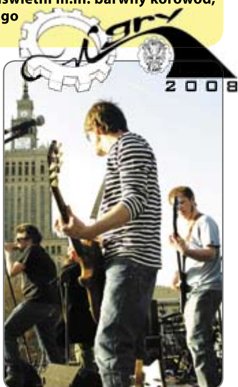
lotnisku zagrają: Zakłamanie, Akcent, Cing G, BIG CYC i T.LOVE. Wystąpi również DJ C-BooL, a całość imprezy poprowadzą konferansjerzy z zespołu Cing G. Nie może Was tam zabraknąć! (kik)

Podobnie jak w roku ubiegłym spragnieni wrażeń żacy mogą liczyć na dzień kulturalny (13 maja) . – Zdradzę, że podczas tzw. COOLturalnej ARTylerii (przygotowywanej przez Uczelnianą Radę Samorządu Doktorantów) poznamy kilka ukrytych talentów. Zainteresowani powin-