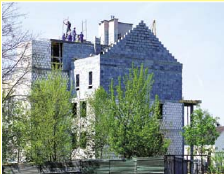
Budowa kompleksu mieszkalnego w rejonie ulic Bernardyńskiej, Toszeckiej i Świętojańskiej przekroczyła już półmetek

Część kosztów budowy pokrywają we własnym zakresie przyszli lokatorzy mieszkań, jak przystało na zadanie inwestycyjne, realizowane w systemie TBS. Czytelne zasady najmu lokali mieszkalnych w tym trybie oraz ich dość wysoki standard techniczny w zestawieniu z niezłą lokalizacją obiektów, sprawiają, że domy wznoszone w ramach Towarzystwa Budownictwa Społecznego cieszą się coraz większą popularnością w naszym mieście. W drugiej połowie ubiegłego roku rozpoczęto kolejne inwestycje TBS. Dwa domy wielorodzinne powstają w centrum miasta, na terenie położonym u zbiegu ulic Mikołowskiej i Wrocławskiej, a następny – przy ul. Witkiewicza 19. Inwestorem jest Zarząd Budynków Miejskich – I Towarzystwa Budownictwa Społecznego. Budowa obiektu przy ul. Witkiewicza potrwa do października br. Powstaną tam 34 mieszkania