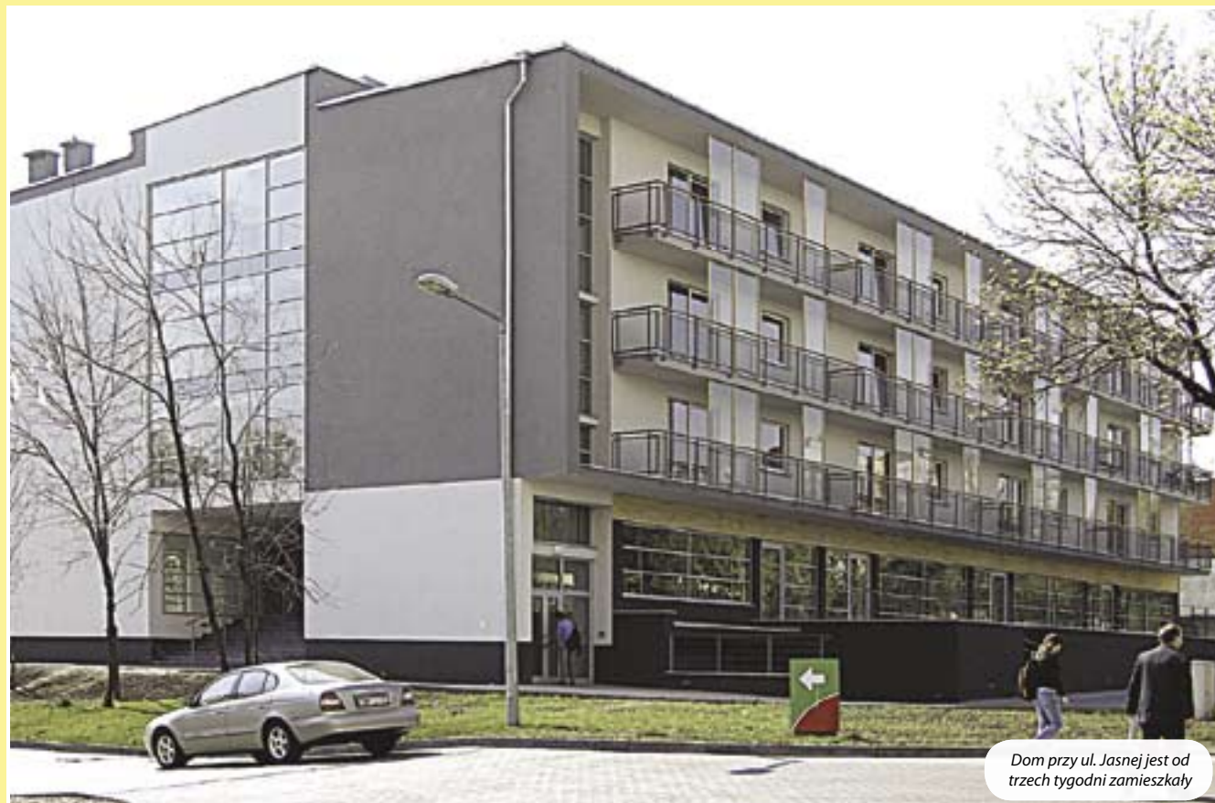
Dom przy ul. Jasnej jest od trzech tygodni zamieszkały

W ubiegłym miesiącu oddano do użytku 27 nowych mieszkań w domu przy ul. Jasnej 5. Lokatorami budynku zostały osoby uprawnione do otrzymania lokali pochodzących z mieszkaniowego zasobu miasta oraz osoby wykwaterowane ze starych gliwickich kamienic, stwarzających zagrożenie budowlane dla otoczenia. Obecnie trwa natomiast w mieście budowa 181 mieszkań Towarzystwa Budownictwa Społecznego. Powstają one przy ulicach Mikołowskiej, Witkiewicza oraz u zbiegu ulic Toszeckiej i Świętojańskiej. Spora część z nich zostanie przekazana najemcom jesienią tego roku.