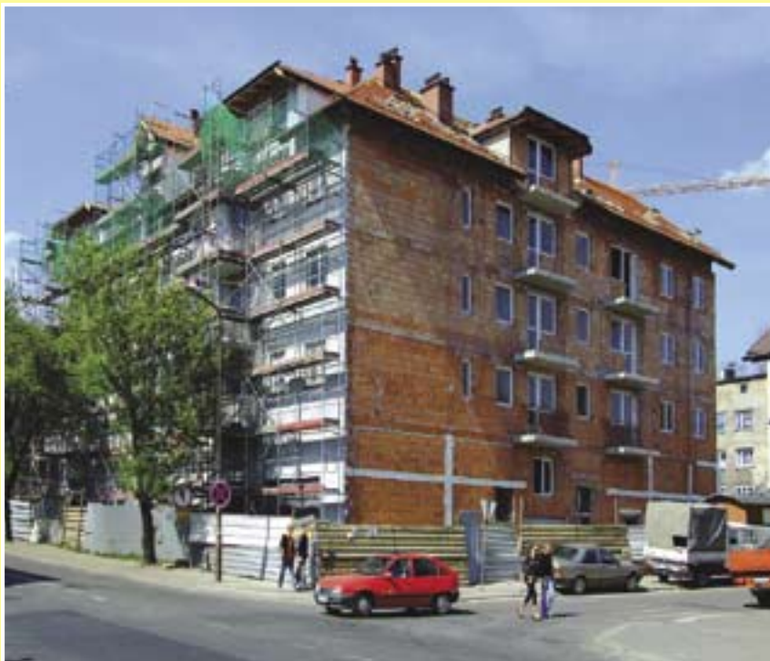
Jesienią lokatorzy będą mogli wprowadzić się do budynku przy ul. Witkiewicza 19

W parterowej części budynku znajduje się 8 lokali użytkowych o powierzchni od 38 do 58 m 2 . Tworzą one tzw. strefę usługową, z której będą mogli korzystać mieszkańcy nowego domu. Inwestycja została w całości sfinansowana ze środków budżetu miejskiego. Kosztowała ok. 5,5 mln zł.