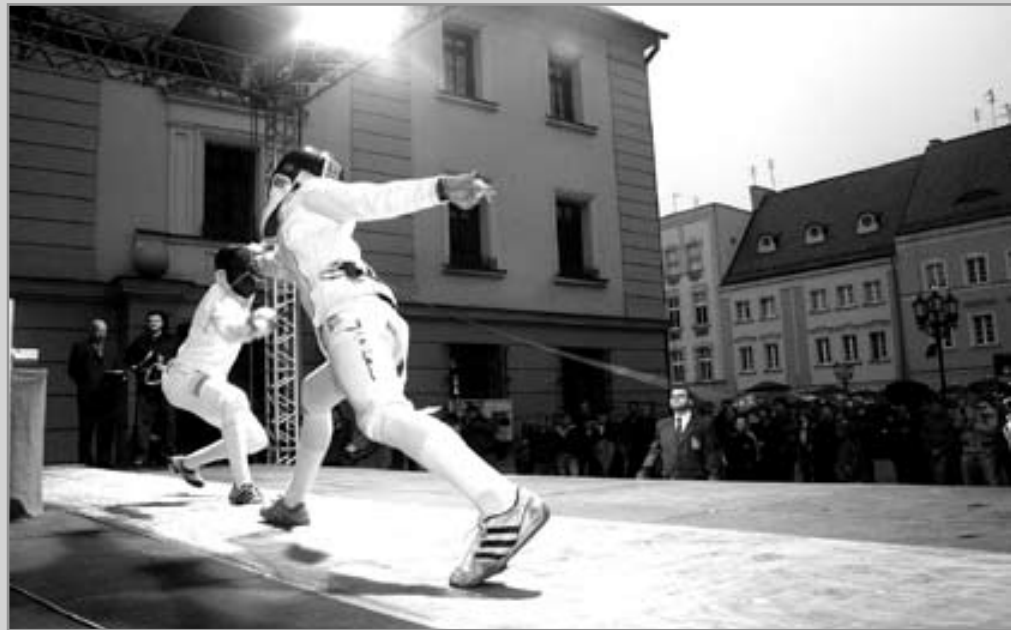
Po zakończeniu turnieju na placu gliwickiego Rynku można było obejrzeć wieczorny, pokazowy mecz szermierczy, rozgrywany między reprezentantami GKS „PIAST” a włoskim zespołem z Bergamo. Puchar Centrum Handlowego „Forum” zdobyli Polacy. W przerwach publiczność oklaskiwała czeską „czwórkę z Liverpoolu” – grupę „The Beatles Revival”.