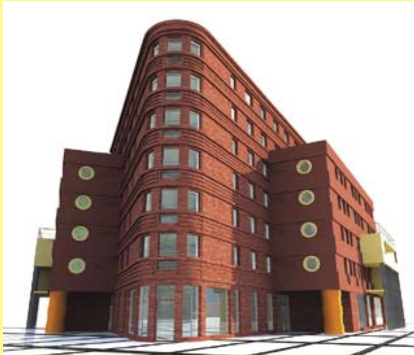
Tak będzie prezentował się narożny budynek u zbiegu ulic Mikołowskiej i Wrocławskiej (oprac. „INWESTPROJEKT”)

Część kosztów budowy pokrywają we własnym zakresie przyszli lokatorzy mieszkań, jak przystało na zadanie inwestycyjne, realizowane w systemie TBS. Czytelne zasady najmu lokali mieszkalnych w tym trybie oraz ich dość wysoki standard techniczny w zestawieniu z niezłą lokalizacją obiektów, sprawiają, że domy wznoszone w ramach Towarzystwa Budownictwa Społecznego cieszą się coraz większą popularnością w naszym mieście. W drugiej połowie ubiegłego roku rozpoczęto kolejne inwestycje TBS. Dwa domy wielorodzinne powstają w centrum miasta, na terenie położonym u zbiegu ulic Mikołowskiej i Wrocławskiej, a następny – przy ul. Witkiewicza 19. Inwestorem jest Zarząd Budynków Miejskich – I Towarzystwa Budownictwa Społecznego. Budowa obiektu przy ul. Witkiewicza potrwa do października br. Powstaną tam 34 mieszkania