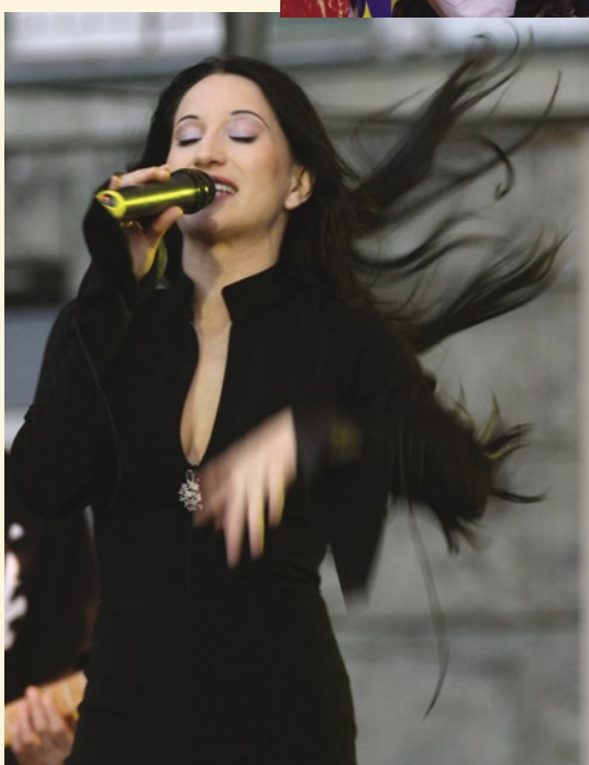
Ekspresyjny koncert Justyny Steczkowskiej wzbudził aplauz publiczności