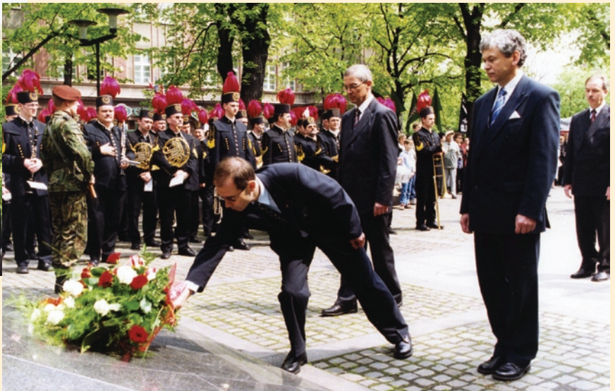
W trakcie uroczystości zorganizowanej pod pomnikiem Marszałka Piłsudskiego z okazji 213 rocznicy uchwalenia Konstytucji 3 Maja delegacja władz miejskich złożyła kwiaty