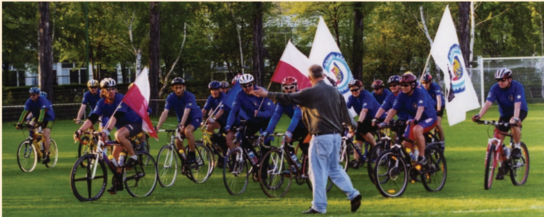
Uczestnicy międzynarodowego rajdu kolarskiego „Gliwice w UE” wrócili po trzech dniach do miasta. Meta rajdu znajdowała się na boisku przy ul. Sokoła.