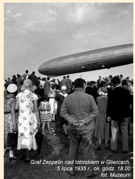
Graf Zeppelin nad lotniskiem w Gliwicach, 5 lipca 1935 r., ok. godz. 18.00

Miejski Zarząd Usług Komunalnych w Gliwicach zawiadamia, że w dniach od 7 do 21 maja br. nastąpi przeniesienie krzyża z centralnego miejsca na Cmentarzu Lipowym do utworzonej niedawno nowej części tej nekropolii (od strony lasu komunalnego). Wykonawcą przedsięwzięcia będzie gliwicka firma WOLIMPEX. MZUK przeprasza odwiedzających groby za ewentualne utrudnienia z powodu planowanych robót. (luz)