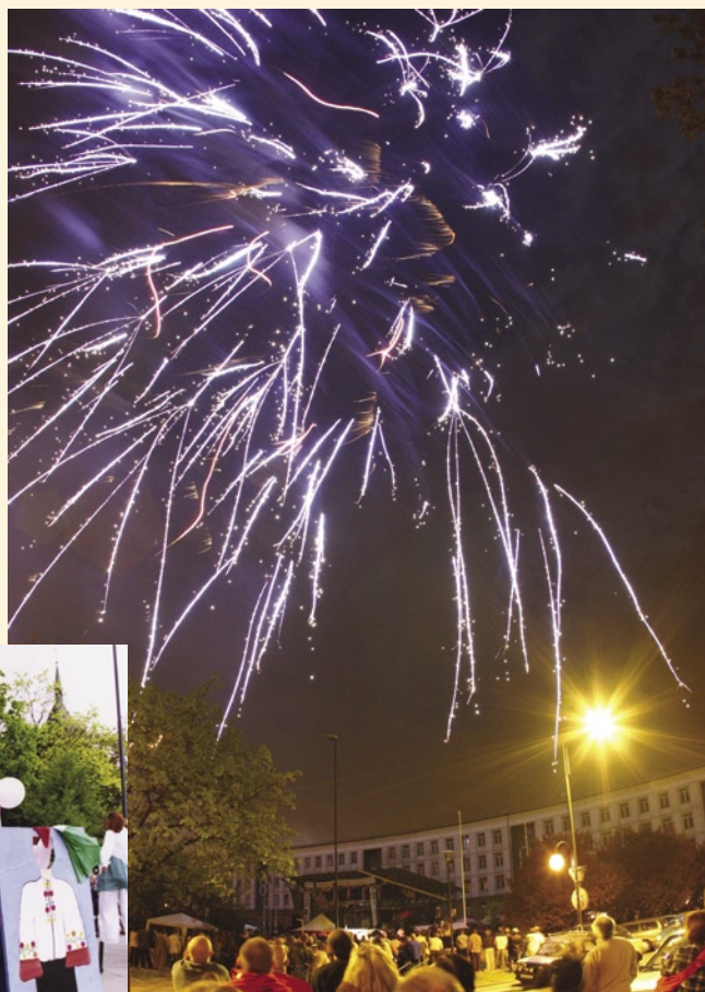
Pokaz sztucznych ogni był efektywnym zwieńczeniem całodziennej imprezy