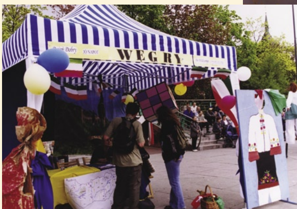
Stoisko zaprzyjaźnionego z Gliwicami węgierskiego miasta Salgotarjan - jeden z kilku podobnych punktów europejskich podczas festynu