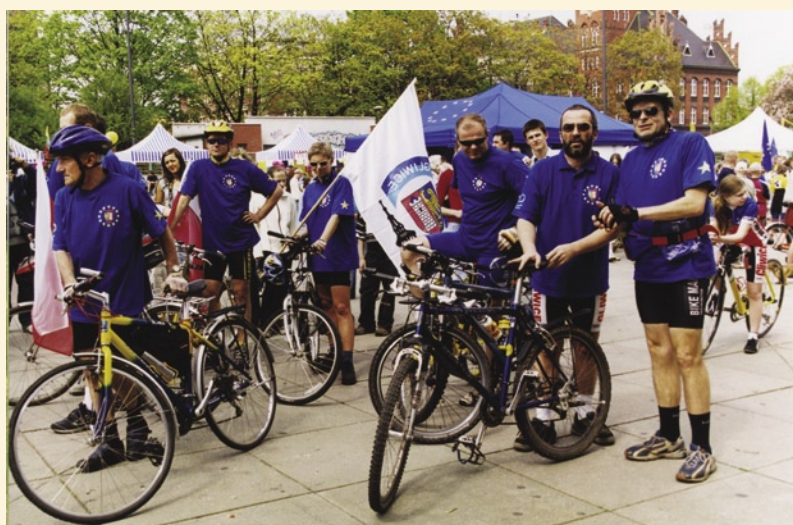
25-osobowa reprezentacja gliwiczian wzięła udział w trzydniowym rajdzie kolarskim pod nazwą „Gliwice w UE”. Zawodnicy mieli do pokonania dystans ok. 350 kilometrów na trasie: Gliwice - Rybnik - Chałupki - Karwina - Czeski Cieszyń - Trzynieć - Cadca - Zwardoń - Wisła - Skoczów - Żory - Mikołów - Gliwice.