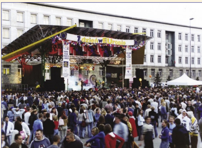
Pierwszomajowe obchody Dnia Europy na placu Krakowskim zgromadziły sporo młodzieży