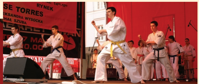
Z zainteresowaniem obserwowano na Rynku pokazy wschodnich sztuk walki