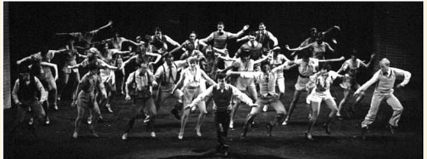
42 Street - "opening number" broadwayowskiej premiery

Pod koniec lat 70. dwóch broadwayowskich artystów – Michael Stewart i Mark Bramble – zrobiło sobie przerwę podczas pracy nad przedstawieniem. Poszli do kina wyświetlającego stare przeboje. „Szło” akurat 42 nd Street. „Ach, szkoda, że nie pracujemy właśnie nad tym” – westchnął jeden z nich. W ten sposób urodził się pomysł przeniesienia kultowego musicalowego filmowego hitu na deski sceny. Do pracy nad produkcją zaproszonych najlepszych. Przede wszystkim, producentem został legendarny rekin Broadwayu David Merrick. Ten z kolei zaangażował równie sławnego reżysera i choreografa – Gowera Championa. Obaj byli kiedyś współautorami wielkiego sukcesu Hello, Dolly! , podobnie zresztą jak wspomniany Michael Stewart. Zaproszenia do współpracy nie przyjął kompozytor Jerry Herman,