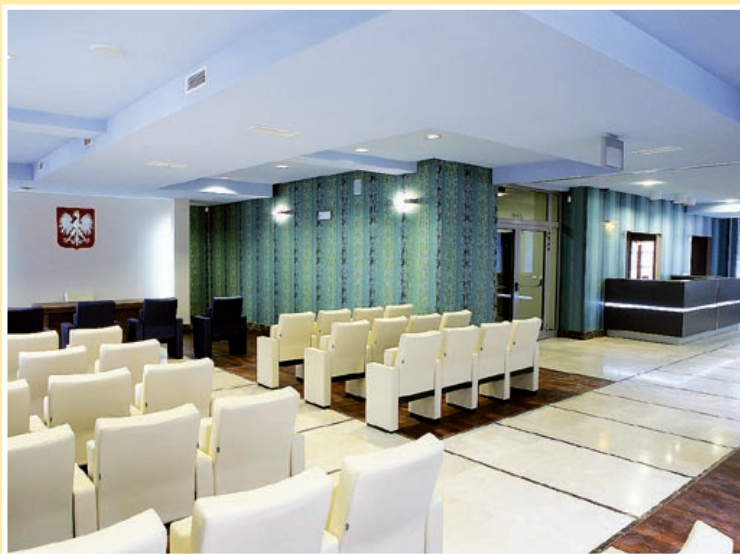
Nowe oblicze sali ślubów USC (parter)

Dobiegł końca roczny, gruntowny remont „nowej – starej” siedziby miejskich rajców na gliwickim Rynku. Już tylko budowlancy pamiętają wszechogarniający kurz i pył, wzbijający się podczas rozbiórki i wyburzeń wewnątrz zabytkowego obiektu. Zmodernizowany Ratusz to teraz nowoczesne centrum konferencyjno-sesyjne, którego kolorystyka (inna na każdej z trzech głównych kondygnacji budynku) nasuwa mimowolnie skojarzenie z... filmowym tryptykiem „Trzy kolory” Krzysztofa Kieślowskiego („Niebieski”, „Biały”, „Czerwony”). Błękitnozielony parter, kremowa biel pierwszego piętra i energetyczny karmin piętra drugiego będą cieszyć – lub zadziwiać – mieszkańców Gliwic, miejskich