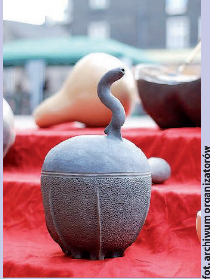
fol. archiwum organizatorów

Początek spotkań – godz. 11.00 (w sobotę) i godz. 10.00 (w niedzielę). Wstęp wolny! Szczegółowe informacje można znaleźć na stronie www.cuforum.pl . (bom)