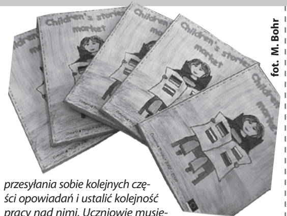
fol. M. Bohr

Piąty rozdział zawiera dwa opowiadania pisane sztafetowo przez uczniów wszystkich szkół. – Było to jedno z trudniejszych zadań projektu, gdyż trzeba było zgrać terminy