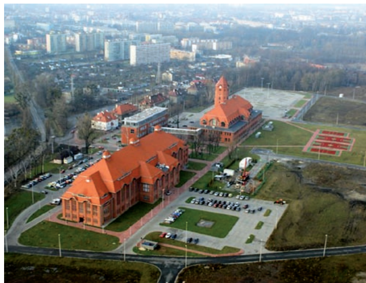
fol. K. Krzeminski

Już po raz dziesiąty będziemy świętować wspólnie DZIEŃ EUROPY. Tradycyjna impreza z tej okazji szykuje się wyjątkowo 8 i 9 maja, tym razem na terenie kompleksu edukacyjno-biznesowego „NOWE GLIWICE” przy ul. Bojkowskiej 37. Co nas czeka? W programie przewidziano m.in. zwiedzanie z przewodnikiem zabudowań „NOWYCH GLIWIC” i wiele atrakcji Dnia Otwartego tego kompleksu, udział w „Pikniku Europejskim” oraz wieczorne szaleństwo podczas sobotnich koncertów zespołu ZAKOPOWER i hipnotyzującej KAYAH. Dwudniową imprezę zamknie pokaz sztucznych ogni i feeria laserowych świateł. Zapraszamy na Bojkowską! Wstęp wolny! Szczegóły (wraz z informacją na temat dojazdów bezpłatnymi autobusami) na str. 8.