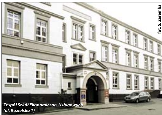
Zespół Szkół Ekonomiczno-Usługowych (ul. Kozielska 1)

W takim samym trybie będzie przeprowadzony wybór projektantów, którzy w tym roku opracują dokumentację techniczną termomodernizacji 16 kolejnych placówek oświatowych w mieście – czterech przedszkoli przy ulicach: Żerom-