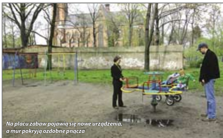
Na placu zabaw pojawiają się nowe urządzenia, a mur pokryją ozdobne pnącza