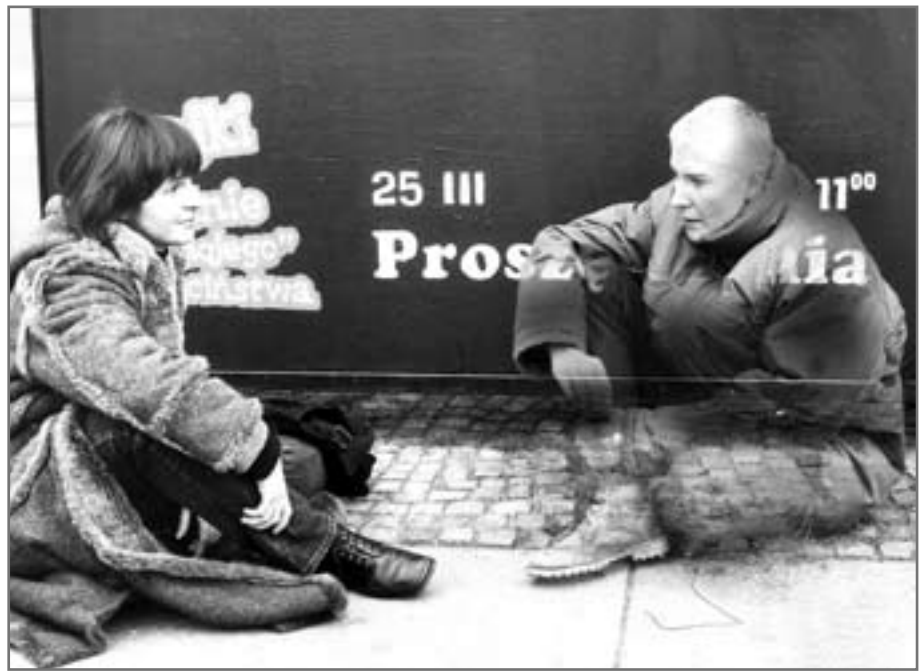
fol. W. Jurewicz (www.jurewicz.art.pl)

Tylko w ubiegłym roku Towarzystwo Pomocy im. Św. Brata Alberta – Koło Gliwice pozyskało z Unii Europejskiej (Inicjatywa Wspólnotowa EQUAL) 161 488,87 zł. Pokazuje to skalę możliwości tkwiącą w lokalnych organizacjach pożytku publicznego. Warto więc przy okazji pamiętać, że każdy z nas może na własną rękę wspomóc wybraną OPP – m.in. poprzez przekazanie na jej rzecz 1% podatku dochodowego. To ostatni dzwonek!