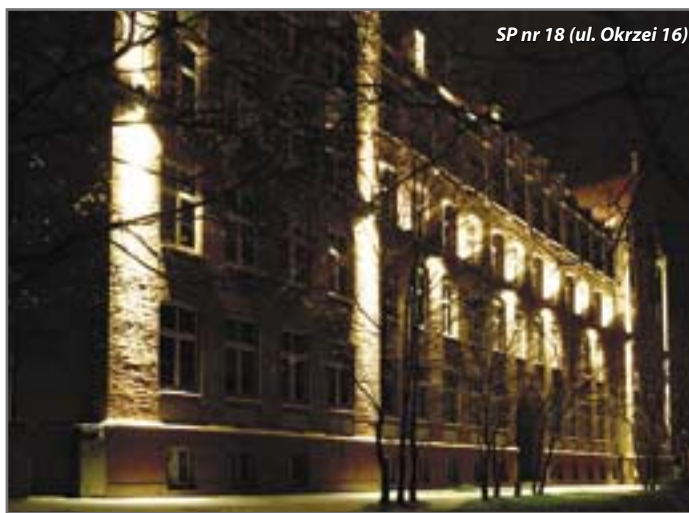
SP nr 18 (ul. Okrzei 16)