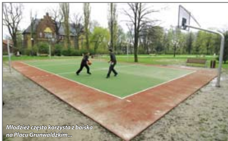
Młodzież często korzysta z boiska na Placu Grunwaldzkim...

Ponad 450 ha powierzchni Gliwic zajmują miejskie tereny zielone. Na ich pielęgnację wydano w ubiegłym roku 4 mln zł. Taką samą kwotę zaplanowano na 2008 rok. W 2007 roku w różnych miejscach Gliwic posadzono 20 317 nowych drzew oraz 5995 krzewów. Całości dopełniło 115 748 sadzonek kwiatowych. W tym roku na terenie miasta przybędzie 24 685 drzew, 10 832 krzewy i 1 207 500 kwiatów. Czym jeszcze zajmą się pracownicy MZUK? – Rozpoczynamy odnawianie kwietników. Chcemy, żeby były kolorowe i estetyczne. Niektóre z nich obsadzamy już bratkami, ale najwięcej różnorodnych kwiatów posadzimy w maju. W tym roku szykujemy też kwiatowe niespodzianki i planujemy ustawić w kilku miejscach miasta duże kwiatowe konstrukcje – informuje Iwona Kokowicz.