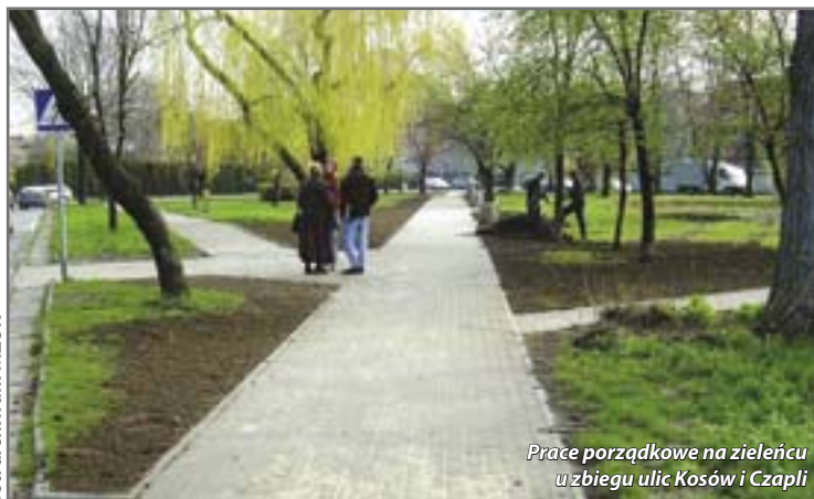
Prace porządkowe na zieleńcu u zbiegu ulic Kosów i Czapli