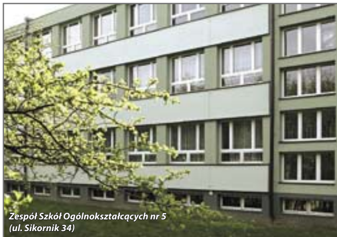
Zespół Szkół Ogólnokształcących nr 5 (ul. Sikornik 34)

skiego, Rydygiera, Mickiewicza i Młodopolskiej, jedenastu szkół przy ulicach: Daszyńskiego, Plonowej, Pocztowej, Elsnera, Wrzosowej, Robotniczej, Gierymskiego, Płockiej, Jasnej, Kilińskiego i Konarskiego oraz Młodzieżowego Domu Kultury przy ul. Rybnickiej. Na ten cel zaplanowano w budżecie miejskim 275 tysięcy zł.