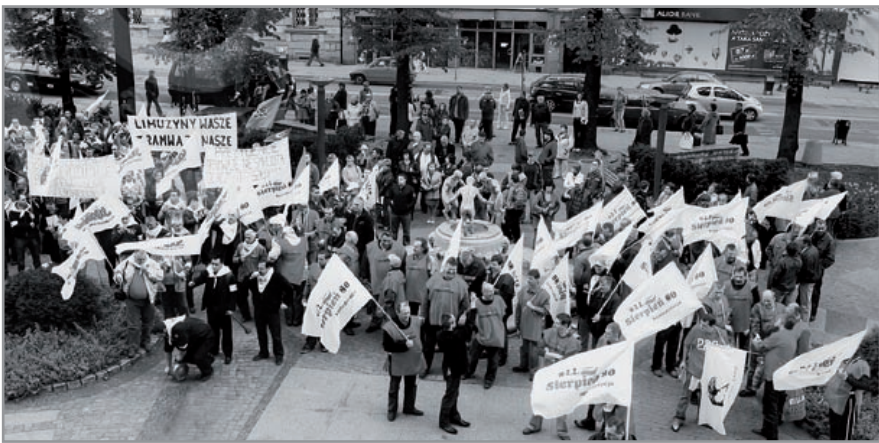
fol. A. Włtwicki

W ubiegły czwartek, 23 kwietnia, przed siedzibą Urzędu Miejskiego odbyła się pikietka związkowców z „Sierpnia 80” i „Solidarności”. Jej uczestnicy protestowali przeciwko zamiarowi likwidacji tramwajów w Gliwicach. Do demonstracji, która rozpoczęła się przed sesją absolutorijną Rady Miejskiej, przyłączyło się niewielu mieszkańców. Przypomnijmy, że sprawa dotyczy proponowanego przez prezydenta Gliwice zastąpienia tramwajów przez autobusy niskopodłogowe, które mogłyby kursować na trasie zbliżonej do tramwajowej. Temu tematowi była poświęcona publiczna debata zorganizowana na początku kwietnia w magistracie przez prezydenta miasta. Gliwiczanie wypełnili wówczas salę sesyjną po brzegi. Jakie prezentowały argumenty? – tego można się dowiedzieć, zaglądając na stronę internetową www.um.gliwice.pl (odsylacz „Debata komunikacyjna”). (al)