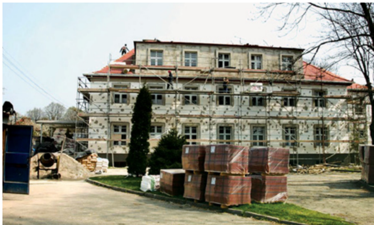
Prace przy ociepleniu budynku szpitala przy ul. Radiowej są mocno zaawansowane

Gliwickie szpitale zmieniają powoli swoje oblicze. W trzech placówkach przejętych w 2002 roku przez władze samorządowe miasta trwają prace przy modernizacji poszczególnych obiektów i dostosowaniu ich do współczesnych potrzeb. Przedsięwzięcie jest zakrojone na szeroką skalę. Wartość robót przekroczyła już kwotę 5 mln zł. Zadania są finansowane z kilku źródeł: budżetu miejskiego, dotacji Unii Europejskiej, środków Narodowego, Wojewódzkiego i Gminnego Funduszu Ochrony Środowiska i Gospodarki Wodnej oraz darowizn fundatorów.