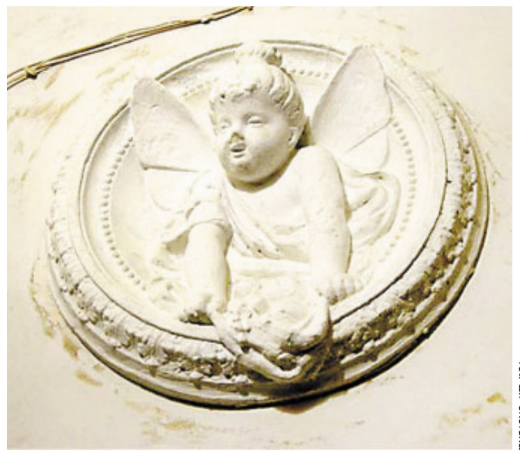
fol. E. Pokorska

Wewnętrzne drzwi, oddzielające sień od klatki schodowej, miały nierzadko przeszklenia z witrażowego szkła. A drzwi wiodące do poszczególnych mieszkań projektowano tak, aby swoją formą nawiązywały do zewnętrznego wystroju elewacji. Bogactwo detali, a często wręcz ich architektoniczna forma, zachwycały przybyszów. Czasami dodatkowo jeszcze wzbogacano wygląd sieni wewnętrznymi witrażami, które służyły jednocześnie dodatkowemu doświetleniu pomieszczeń. Nie tylko klatki schodowe miały zwracać uwagę osób wchodzących. Pamiętano także o bramach wjazdowych. Ktokolwiek wejdzie np. do bramy w kamienicy przy ul. Chudoby 6, zobaczy – umieszczoną przy wejściu - interesującą płaskorzeźbę, przedstawiającą jeźdźca na rydwanie. Natomiast w kamienicy przy Alei Korfańtego 14 zachwyca polichromia, pochodząca z 1897 roku. Jest to jedyne takie dzieło sztuki w Gliwicach, umieszczone w dwóch prostokątnych przęsłach sklepienia bramy. Przedstawia motyw kołaze stylizowaną rozetą w środku.