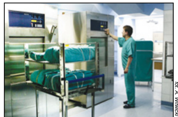
Personel Szpitala nr 1 jest dumny z nowoczesnych urządzeń do sterylizacji narzędzi chirurgicznych

W najbliższym czasie zostanie rozstrzygnięty przetarg na zakup wysokospecjalistycznej aparatury i sprzętu medycznego dla trzech gliwickich szpitali. W efekcie otrzymają one m.in.: urządzenie do elektrokoagulacji operacyjnej, głowicę naczyniową USG, monitor wielofunkcyjny oraz aparat Holtera do badań ciśnieniowych. (luz)