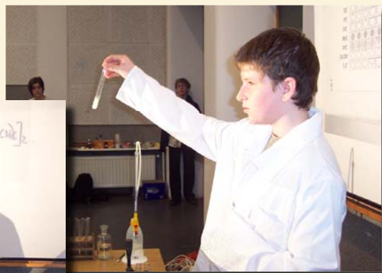
fot. archiwum szkoły