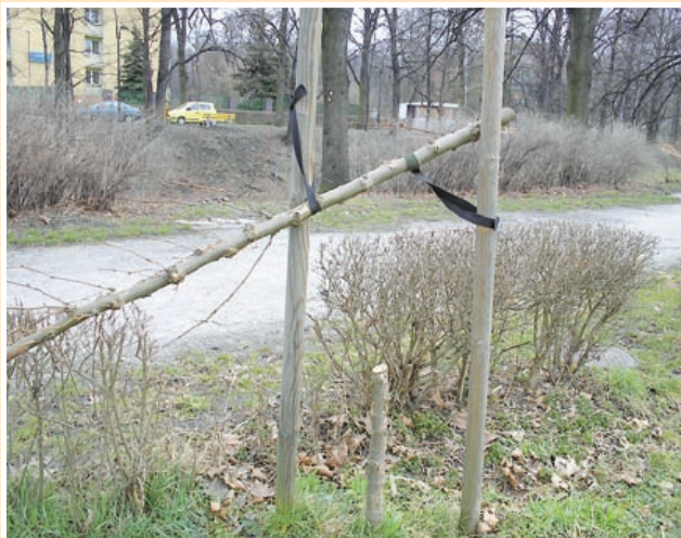
fol. archiwum MZUK