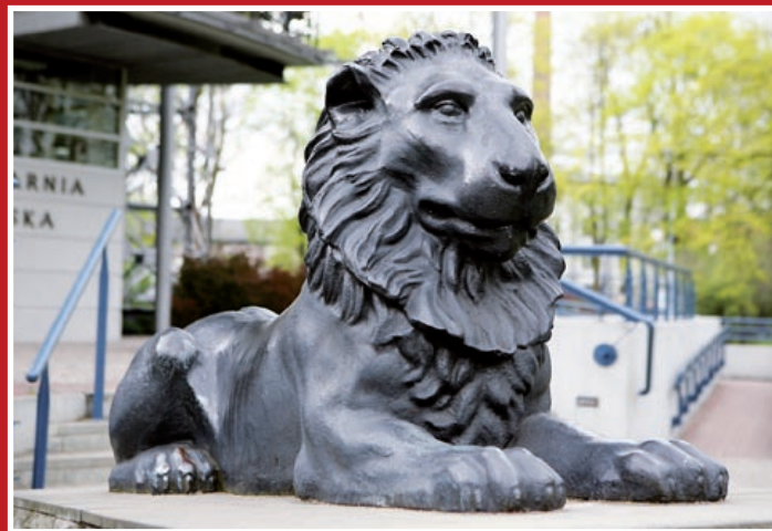
Jeden z dwóch czuwających lwów przed Palmiarnią Miejską (autor rzeźby – Jan Gottfried Schadow)