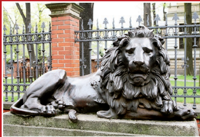
Rzeźba czuwającego lwa przed Willą Caro zostanie odrestaurowana (autor rzeźby – Theodor Erdmann Kalide)