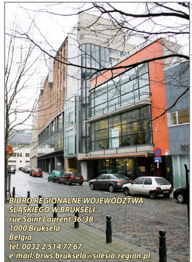
BIURO REGIONALNE WOJEWÓDZTWA ŚLĄSKIEGO W BRUKSELI rue Saint Laurent 36/38 1000 Bruksela Belgia tel. 0032 2 514 77 67 e-mail: brws.bruksela@silesia-region.pl

– Pracujemy na wizerunek placówki dobrze zorganizowanej, przyszłościowej, głęboko zakorzenionej w rzeczywistości regionalnej i unijnej oraz rozpoznawalnej. Do tej pory nawiązaliśmy wiele przydatnych kontaktów roboczych z przedstawicielami instytucji europejskich, reprezentacji regionów Starego Kontynentu zaprzyjaźnionych z województwem śląskim i nie tylko, a także z polskimi i zagranicznymi