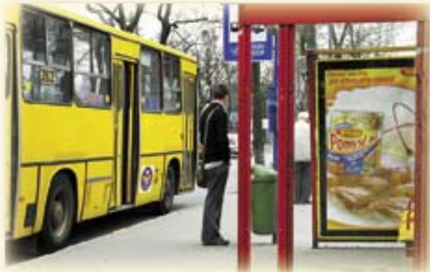
Sprzątaniem terenu wokół gliwickich wiat przystankowych zajmuje się firma z Bytomia

Sklepy spożywcze i placówki gastronomiczne muszą być wyposażone w kosze na śmieci , ustawione przy wejściu do lokali w miejscach dostępnych dla klientów. Uliczne kosze na śmieci będą natomiast rozmieszczane w miejscach szczególnie uczęszczanych (centra i ulice handlowe, sklepy, parkingi, parki, zieleńce, place zabaw, przystanki komunikacji publicznej itp.) w ilości uzależnionej od potrzeb. Pojemność pojedynczego kosza ulicznego nie powinna być mniejsza od 40 litrów . (luz)