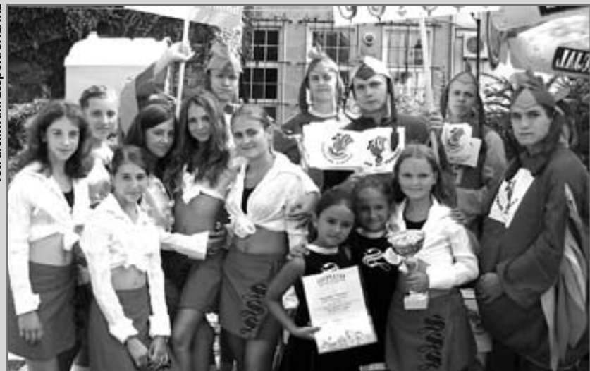
Najprzyjemniejsza część rywalizacji – pozowanie do zdjęć