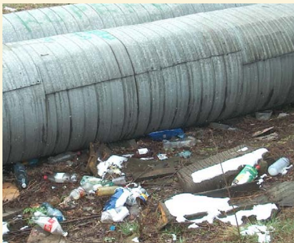
Obok ciepłociągu najszybciej spod śniegu wyrzwały... butelki