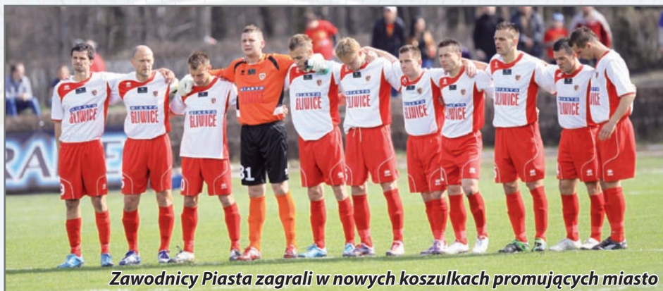
Zawodnicy Piasta zagrali w nowych koszulkach promujących miasto

Fanom piłkarskim rozdano 4 tysiące takich koszulek – niebieskich i czerwonych, z logo Piasta oraz z napisem – MÓJ KLUB, MOJE MIASTO GLIWICE. – To był bardzo dobry pomysł. Koszulki są dobrej jakości. Na każdym meczu kibice