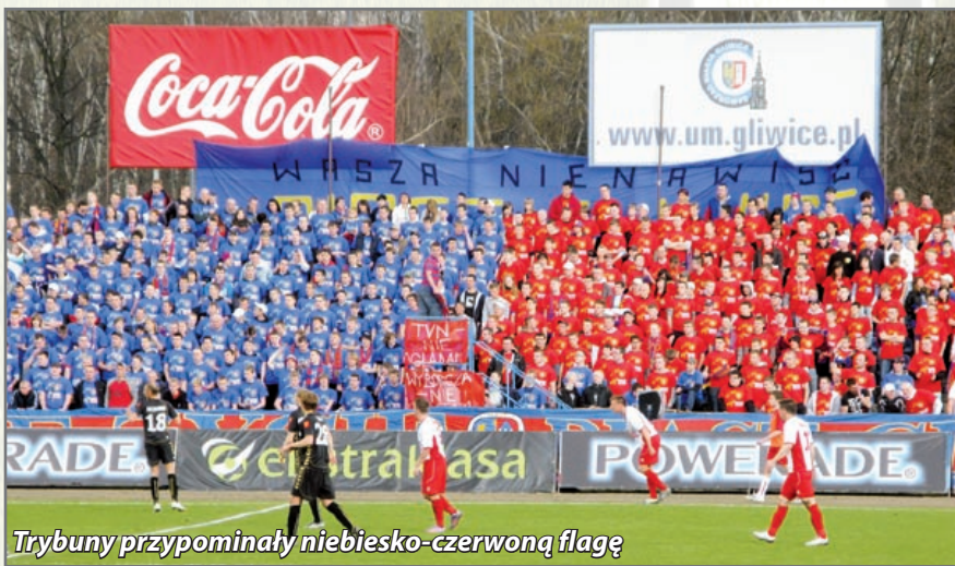
Trybuny przypominały niebiesko-czerwoną flagę