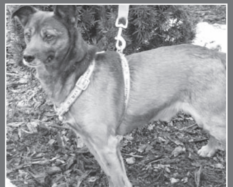
ZYGMUNTEM – 6-letnim, łagodnym psem znalezionej przy ul. Zygmunta Starego.

Schronisko dla Zwierząt organizuje adopcje od poniedziałku do piątku, w godz. od 10.00 do 16.00 i w soboty od 10.00 do 15.00. Wydawane zwierzęta są zaszczepione, wysterylizowane i przyjaźnie nastawione do ludzi.