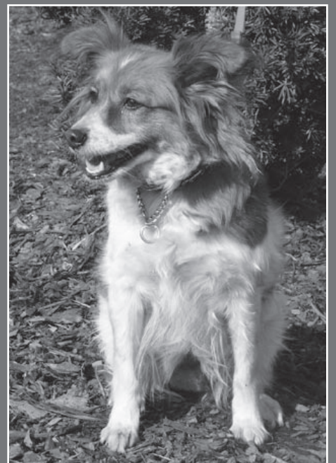
CZUPIRADŁEM – uroczą suczką nauczoną czystości, znalezionej przy ulicy Franciszkańskiej.