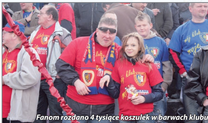
Fanom rozdano 4 tysiące koszulek w barwach klubu