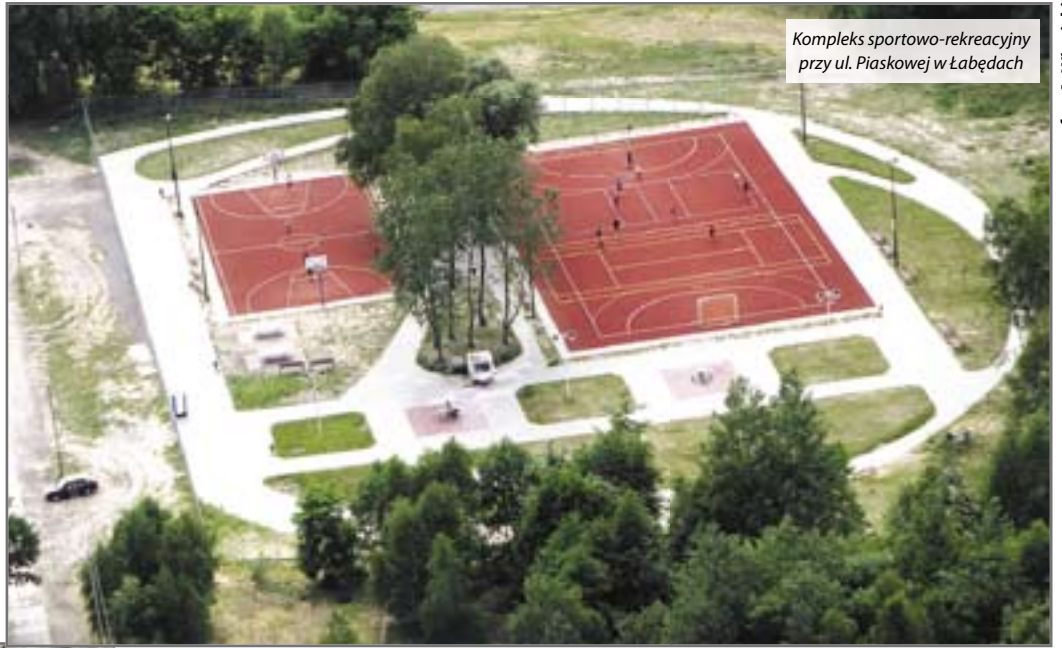
Kompleks sportowo-rekreacyjny przy ul. Piaskowej w Łabędach

– Zakres robót remontowych i modernizacyjnych wynikał z potrzeb szkół oraz mieszkańców poszczególnych dzielnic miasta. Decydujące znaczenie dla projektantów i wykonawców realizowanych zadań miały względy bezpieczeństwa osób ko-