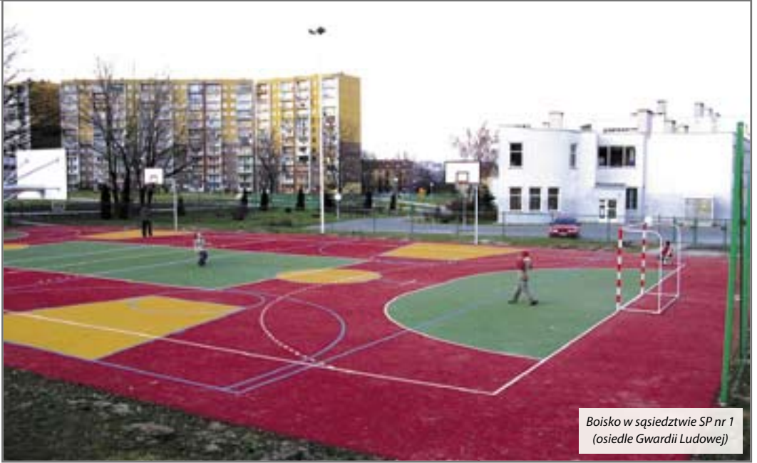
Boisko w sąsiedztwie SP nr 1 (osiedle Gwardii Ludowej)

– Prace przy budowie nowego kompleksu sportowego w mieście ruszą na początku III kwartału. Planuje się, że obiekt zostanie oddany do użytku jeszcze w tym roku. Będą mogli z niego korzystać zarówno uczniowie pobliskich szkół, jak i wszyscy zainteresowani mieszkańcy miasta – zapewnia Tomasz Pawlak z Wydziału Inwestycji i Remontów UM. (luz)