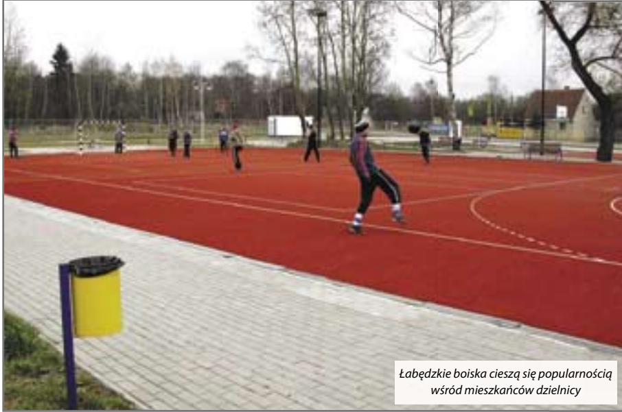
Łabędzkie boiska cieszą się popularnością wśród mieszkańców dzielnicy