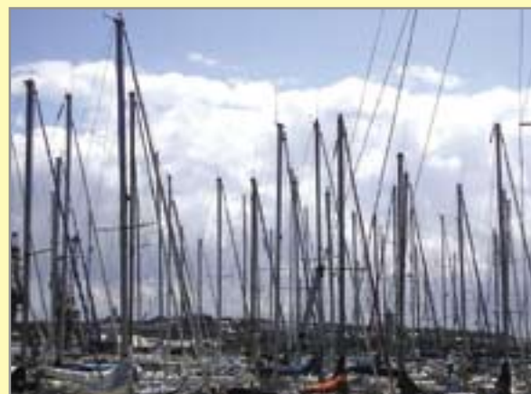
W lesie masztów w porcie Saint Malo trudno odszukać „Asteriasa”

cieśniny Pentland Firth – zawinięto 13 ( nomen omen ) lipca do portu w Świnoujściu.