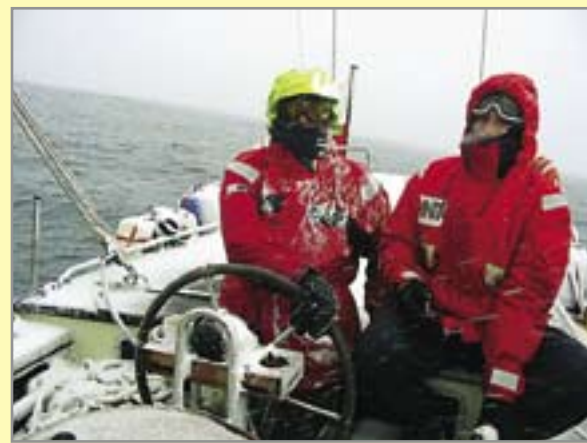
„Stary” w drodze na Antarktydę

Zawiedli ludzie, nie „Asterias”. Ostatnią przystanią dzielnego żaglowca okazała się rafa koralowa u wejścia do kubańskiej maryny Barlovento. Było to 24 lutego 1990 roku. W dziejach klubu zamknęła się tym sposobem 15-letnia era „morskiego mocarstwa”. Amatorzy dalszych przygód z oceanami mogli już tylko liczyć na jachty czarterowane u obcych armatorów.