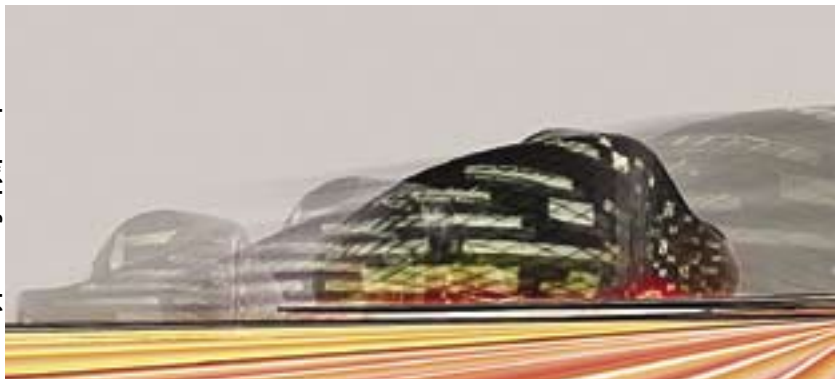
materiały prasowe grupy „plus8.pl”

Mamy ogromną nadzieję, że materiał przyjęty z zainteresowaniem, a zarazem sporą dawką dystansu. Zamieszczając go, nie chcieliśmy narazić na szwank zawodowej pozycji grupy „plus8.pl”, lecz – wręcz przeciwnie – rozpropagować ich pomysły. Wszystkim Czytelnikom życzymy wielu okazji do uśmiechu przez cały rok! (kik)