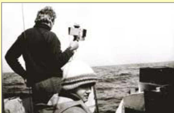
ATLANTYK'83 – w drodze na Kanary

Gliwickie wilki morskie wyruszyły w następne wojaże 6 września 1980 roku. W pięcioetapowej, ostatecznie 12-miesięcznej żegludze, na pokładzie „Asteriasa” przebywało 33 członków klubu. Połowę stanowili żacy. Wymiany załóg przeprowadzono w Casablance, na Grenadzie i – dwukrotnie – w Hawanie. Podróżnicy „zaliczyli” w ramach rejsu Małe i Duże Antyle oraz wyspy u wybrzeży Meksyku (łącznie z wycieczkami w głąb Jukatenu). Wyprawa trwała blisko rok ze względu na niespodziewany defekt statku na początku eskapady. Na Atlantyku w rejonie Lizbony złamał się bowiem maszt „Asteriasa”. Awaryjny postój w sfilmowanym przez Wendersa zakątku Portugalii trwał prawie dwa miesiące.