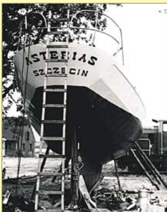
W gliwickim porcie – przygotowania jachtu do wyprawy

Tam zdobywano podstawowe stopnie i szlifowano umiejętności. Po wyższe uprawnienia należało wyruszyć nad morze, do centralnych ośrodków szkoleniowych. Każdy kolejny rejs pod cudzą banderą wzmagał marzenia o własnym jachcie morskim. I co najlepsze, idea ta znalazła realizatorów! – Grupa zapaleńców pod wodzą Andrzeja Kurzei, wspierana „pospolitym ruszeniem” członków klubu, wspomagana przez rodzimą Politechnikę, gliwickie zakłady pracy i „fachowców od lokomotyw”, rozpoczęła w Gliwickich Zakładach Lokomotyw Elektrycznych budowę stalowego kadłuba jachtu typu J-80 (80 metrów kwadratowych ożaglowania, 14 metrów długości) – w taki mniej więcej sposób, odwzorowujący górnolotny styl komunikatów z minionej epoki, można by opisać początki prac konstrukcyjnych nad budową uczelnianego żaglowca.