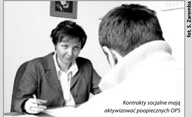
Kontrakty socjalne mają aktywizować podopiecznych OPS

Z Działem Pomocy Środowiskowej OPS (ul. Górnych Wałów 9) można kontaktować się telefonicznie pod numerami 032-401-04-15 lub 032-401-04-16 w poniedziałki od godz. 7.30 do godz. 17.00 oraz we wtorki, środy, czwartki i piątki w godzinach od 7.30 do 15.30. Pracownicy DPS starają się udzielić niezbędnych informacji bądź skierować rozmówców do innych jednostek organizacyjnych OPS.