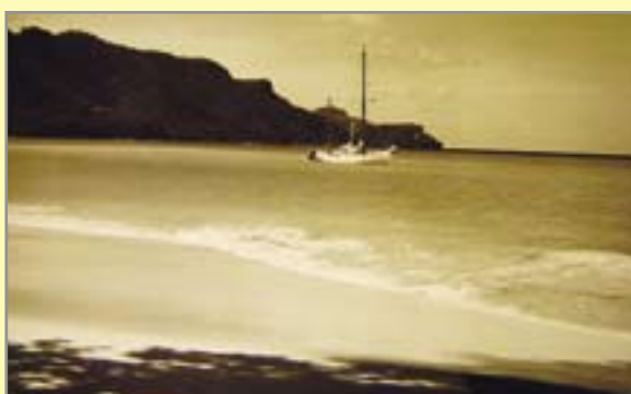
KARAIBY'80 – „Asterias” kotwiczony u brzegu jednej z wysp na Małych Antylach

Gliwickie wilki morskie wyruszyły w następne wojaże 6 września 1980 roku. W pięcioetapowej, ostatecznie 12-miesięcznej żegludze, na pokładzie „Asteriasa” przebywało 33 członków klubu. Połowę stanowili żacy. Wymiany załóg przeprowadzono w Casablance, na Grenadzie i – dwukrotnie – w Hawanie. Podróżnicy „zaliczyli” w ramach rejsu Małe i Duże Antyle oraz wyspy u wybrzeży Meksyku (łącznie z wycieczkami w głąb Jukatenu). Wyprawa trwała blisko rok ze względu na niespodziewany defekt statku na początku eskapady. Na Atlantyku w rejonie Lizbony złamał się bowiem maszt „Asteriasa”. Awaryjny postój w sfilmowanym przez Wendersa zakątku Portugalii trwał prawie dwa miesiące.