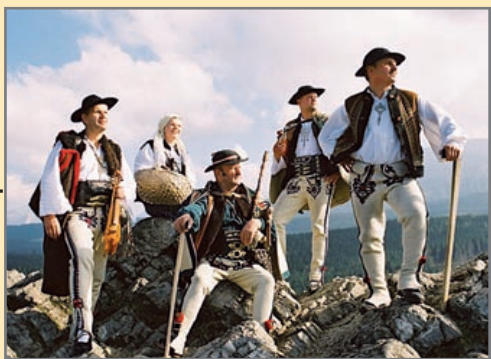
fol. archiwum zespołu

Ze względu na ograniczoną liczbę miejsc, dla zainteresowanych udziałem w imprezie przygotowano bezpłatne wejściówki, które wcześniej należy odebrać w galerii (od wtorku do piątku w godzinach od 10.00 do 18.00 oraz w sobotę i niedzielę od 12.00 do 17.00; w poniedziałek nieczynne). Szczegółowe informacje można znaleźć na stronie internetowej www.galeriampik.pl . Zapraszamy! (bom)