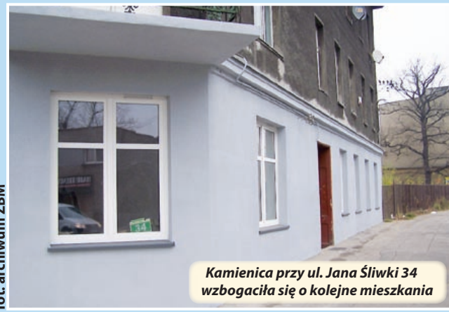
Kamienica przy ul. Jana Śliwki 34 wzbogaciła się o kolejne mieszkania