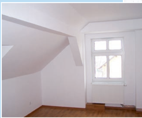
Dom przy ul. Bernardyńskiej 59 nabrał nowych barw

Pod względem ekonomicznym były to opłacalne – w ocenie ekspertów – operacje techniczne. – Należy przypomnieć, że tzw. wskaźnik przeliczeniowy odtworzenia metra kwadratowego powierzchni użytkowej budynków mieszkalnych dla województwa śląskiego został ustalony na poziomie 3235 zł. W Gliwicach uzyskaliśmy natomiast nowe mieszkania komunalne mniejszym sump-