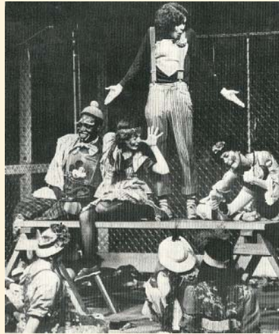
Godspell w 1971 r.

którejs z dawnych epok. Szybko przekonał promotorów, że nie ma nic bardziej klasycznego niż Biblia . Godspell – bo tak nazwał swoją rockandrollową wersję Ewangelii wg św. Mateusza – został w college’u przyjęty z entuzjazmem, który wkrótce rozprzestrzenił się poza szkolne mury, a dokładnie w kierunku nowojorskiego off-off-broadwayowskiego Cafe La Mama Ellen Stewart,